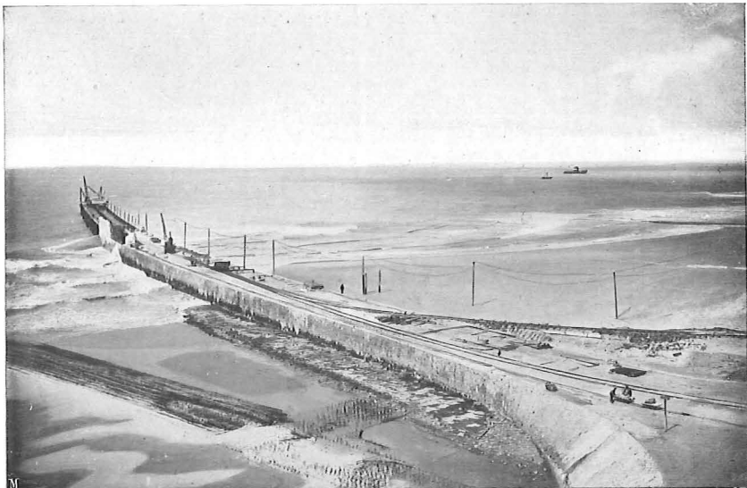
JETÉE SUR L'ESTRAN.