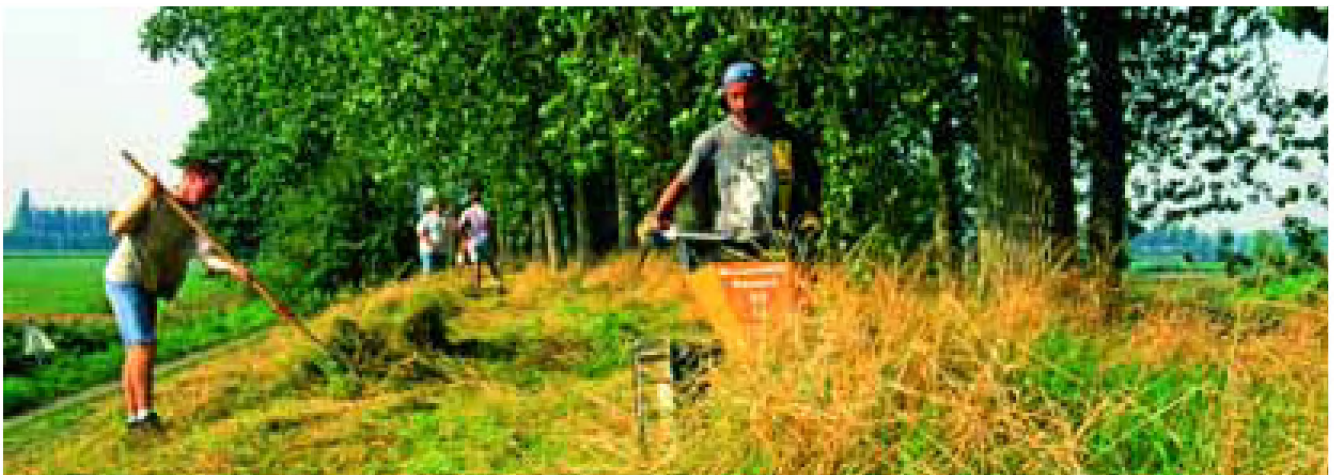
Beheer van een bloemdijk.

Alle natuurgebieden binnen de Zeeuwse EHS die voldoen aan de normen voor ontsluiting en toegankelijkheid en waar een beheerspakket wordt afgesloten, komen in aanmerking voor de recreatiesubsidie. Het recreatiepakket 85 wordt opgesteld voor alle natuurgebieden. Het pakket is beschreven in bijlage 6.