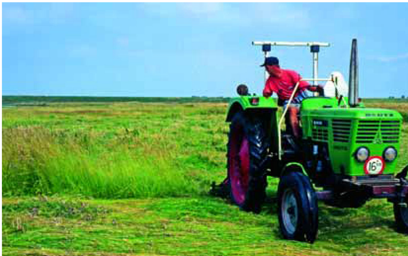
Maaibeheer in een natuurgebied.

Voor het aanvragen van overeenkomsten worden elk jaar een of meer inschrijvingsperioden opengesteld. De precieze