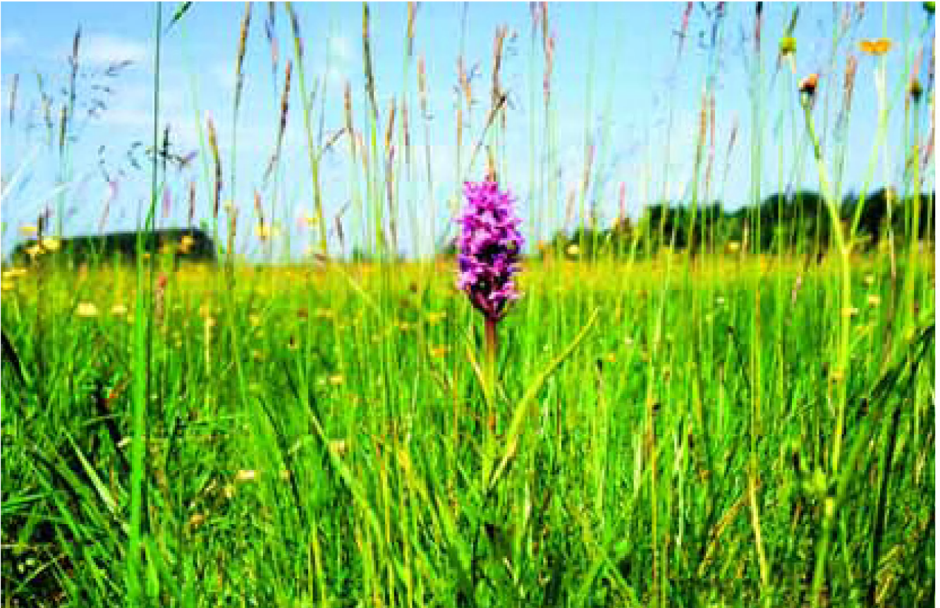
Nat schraalgrasland, een bijzonder natuurdoeltype.

natuurbeheer voorop. Dit geldt bijvoorbeeld voor de Hengstdijkse Putting, de karrenvelden rond Zierikzee en het Strijdersgat. Integrale begrazing en integraal waterbeheer zijn hier noodzakelijk. Op kaart 4 is weergegeven waar de grote halfnatuurlijke natuurgebieden zijn gelegen.