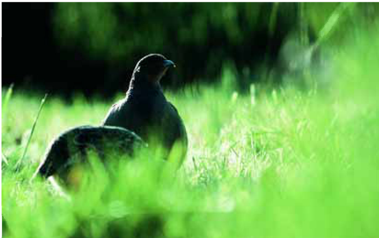
De Patrijs, doelsoort voor het faunarandbeheer.

Weidevogelpakketten zijn opgesteld voor alle vochtige tot droge, reliëfarme en zoete voedselrijke graslanden van het zeeleigebied. Hier is tevens een eenvoudiger pakket (10-landschappelijk waardevol grasland) toegevoegd, waarop kan worden teruggevallen wanneer de verplichte rustperiode niet gehaald kan worden.