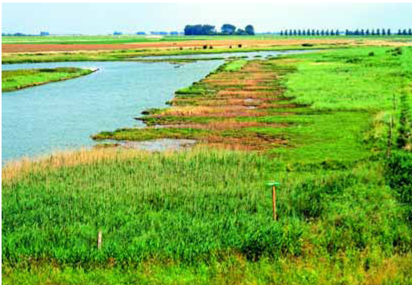
De Van Haaftepolder, een natuurgebied op Tholen.

Tenslotte wordt in hoofdstuk 5 beschreven hoe het Natuurgebiedsplan in de praktijk kan worden toegepast. Daarbij wordt ook de taakverdeling tussen de diverse organisaties en de communicatie bij de uitvoering van het natuurbeleid beschreven.