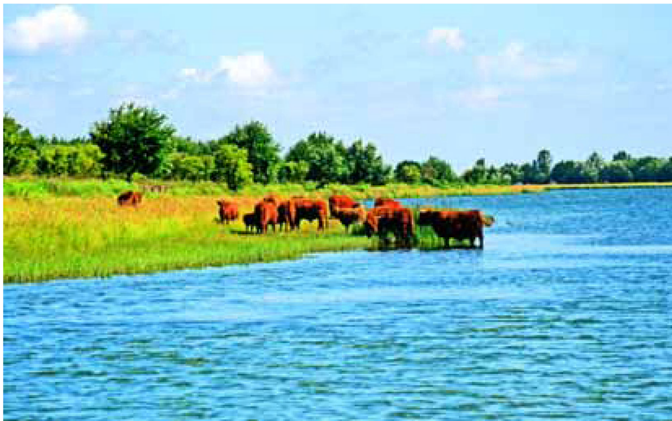
Natuurlijke begrazing op de Slikken van de Heen.

culiere beheer. Er lopen in Zeeland enkele experimenten, waarvan de voorbereiding de nodige inspanning en creativiteit blijkt te kosten. Voor veel particulieren, zowel boeren als ook landgoedeigenaren, is het nog wennen. Ook blijkt de nieuwe Subsidieregeling Natuurbeheer nog de nodige onvolkomenheden te kennen, wat de invoering van particulier beheer bepaald niet makkelijker maakt. In dit Natuurgebiedsplan wordt er dan ook bewust voor gekozen om in plaats van met een definitieve kaart vooralsnog te werken met bovengenoemde criteria en geen gebied met actieve beheerstrategie te begrenzen.