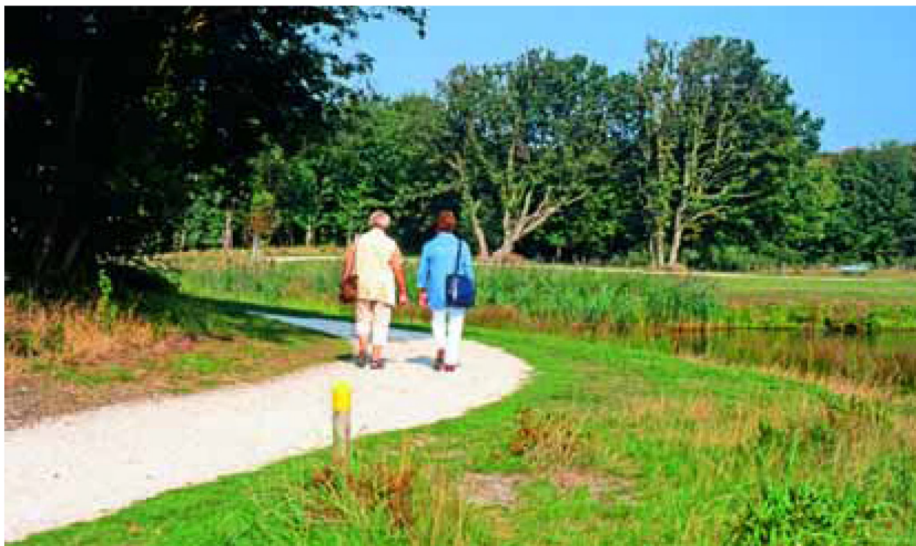
Recreatievoorzieningen in de Manteling van Walcheren.

In nieuwe natuurgebieden vormt de recreatieve inrichting een standaardonderdeel van het natuurontwikkelingsplan. Dit betekent dat wandelpaden, uitkijkpunten en informatievoorzieningen worden meegenomen in de inrichting van deze gebieden. In het cultuurlandschap bieden de dijken, kreken, agrarische beheersgebieden en landschapselementen interessante aan-