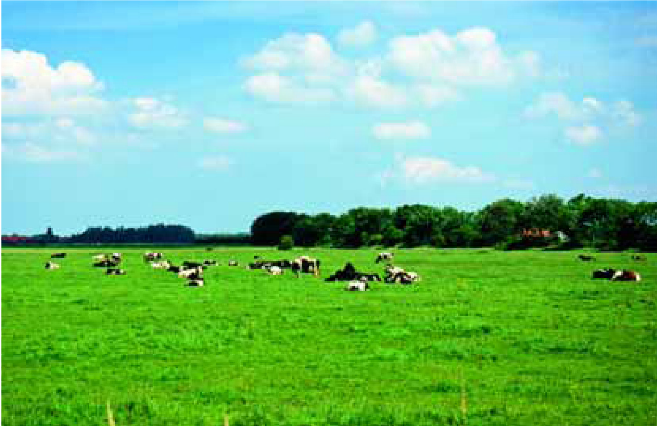
Agrarisch beheersgebied nabij St. Laurens.