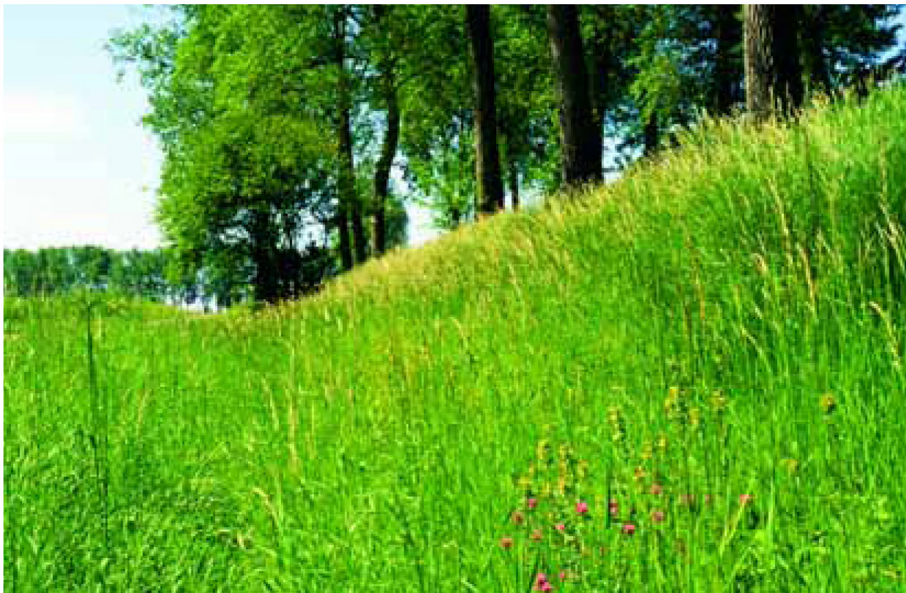
Een bloemdijk in de Zak van Zuid-Beveland.

dijken kunnen een verzoek om begrenzing bij de Provincie Zeeland indienen. Zodra dit verzoek is gehonoreerd, kan men een beheersovereenkomst aanvragen bij de Dienst Regelingen. In dit plan worden ook de beheerspakketten voor de verschillende dijktypen beschreven. Op de beheerspakketten voor binnendijken wordt nader ingegaan in hoofdstuk 3.