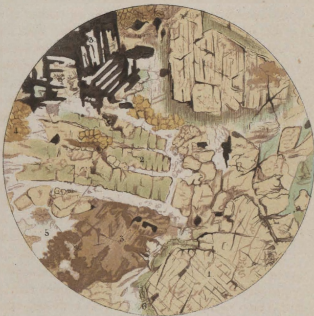
Diabase de Challes. \frac{1}{40}

1. Augite. 2. Feldspath alteré. 3. Ilmenite. 4. Epidote. 5. Quartz. 6. Chlorite.