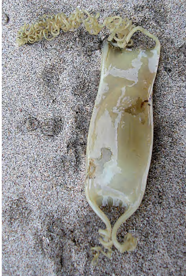
Eikapsels van de Hondshaai ( Scyliorhinus canicula ) worden gekenmerkt door de geelbruine kleur en de draadachtige gekrulde hoorns aan de hoeken van het eikapsel. Eikapsels van roggen zijn donkerbruin tot zwart van kleur. De hoorns zijn vrij stijf en zijn niet gekruld.

Voor zeven van de elf roggensoorten geldt dat er voldoende waarnemingen zijn van eikapsels om een statistische analyse te kunnen uitvoeren op de waarnemingsgegevens. Uit de analyse blijkt dat van zes van de zeven roggensoorten het aantal aangespoelde eikapsels zeer sterk is afgenomen (Gmelig Meyling, 2009). Voor de Grootoogrog ( Raja naevus ), de Blonde rog ( Raja brachyura ), de Kleinoogrog ( Raja micocoelata ) en de Gevlekte rog ( Raja montagui ) geldt dat eikapsels na 1965 nauwelijks nog zijn aangetroffen, terwijl die voordien geregeld werden gevonden (fig. 1). Eikapsels van de Vleet ( Raja batis ) waren vóór 1962 al vrij zeldzaam, maar nadien is er geen één op onze stranden meer waargenomen (fig. 2). Vóór 1970 werd de Vleet geregeld gevangen in het Nederlandse deel van de Noordzee, maar na 1970 zijn daar nog slechts enkele Vleten waargenomen (Heessen & Ellis, dit nummer). Eikapsels van de