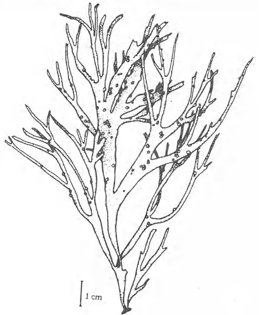
Fig. 3 : Gracilaria foliifera