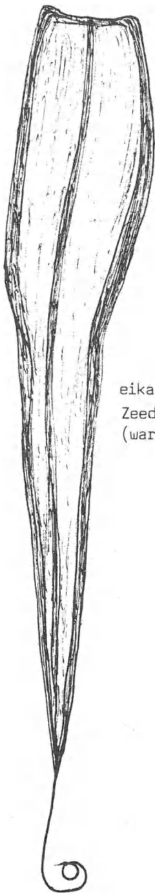
eikapsel van de Zeedraak (ware grootte)