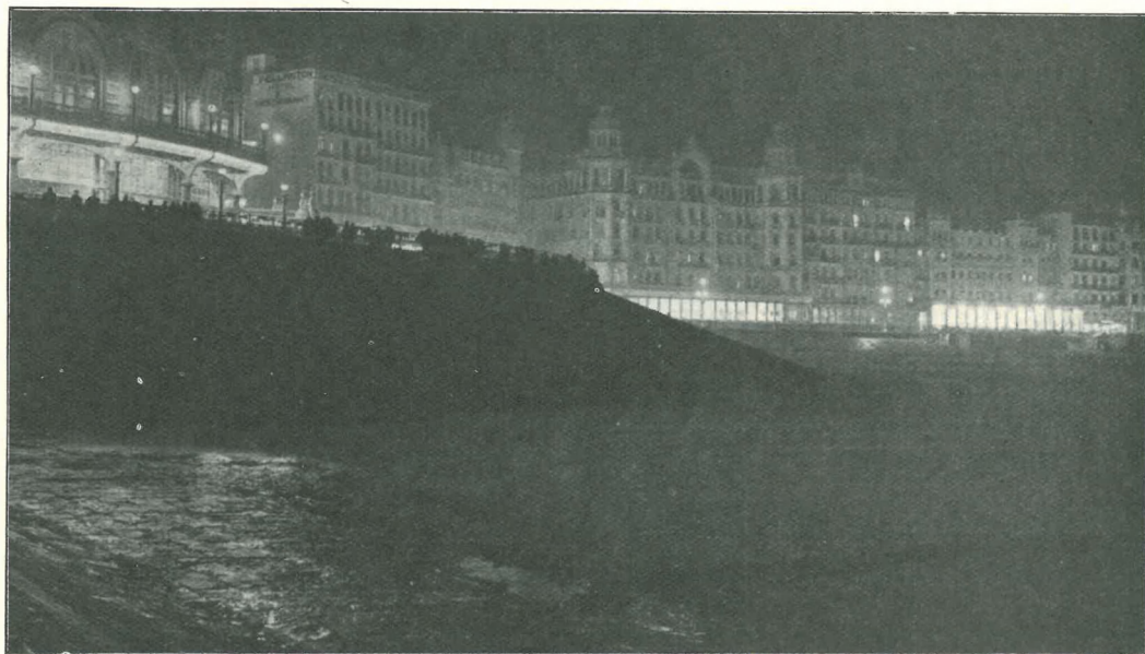
La digue le soir.

réunions brillantes de l'hippodrome, bals et cortèges; si après les rêveries à l'estacade, les siestes sur la plage, les