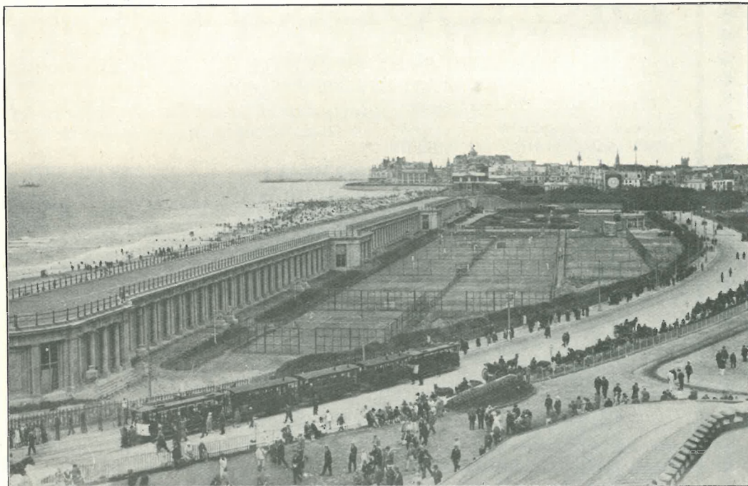
La digue, le Kursaal et les galeries.

Peu à peu, l'on vit sur la rude cité maritime se greffer une