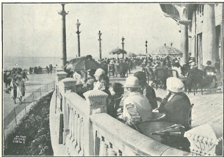
La terrasse du Kursaal.

mands, des Français du Nord, vinrent passer quelques jours d'été à Ostende, logés chez l'habitant. Cet apport étranger créa un état nouveau. Des villas furent construites, des fêtes