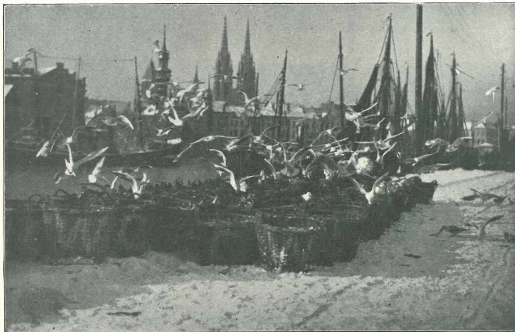
Coin du port de pêche (hiver 1929).

S'il ne se lasse d'admirer ta digue imposante, prolongeant sa jetée unique, devant un horizon marin illimité; s'il apprécie tes réjouissances :