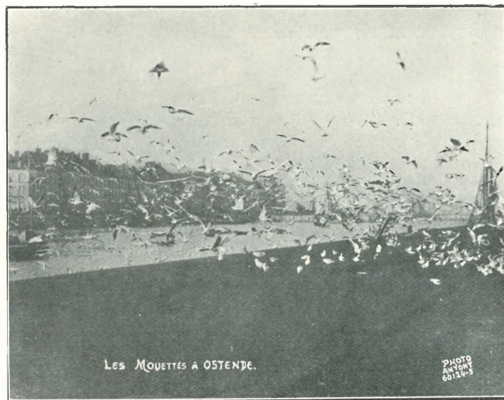
LES MOUETTES A OSTENDE.

devint une petite ville, pourvue d'une digue et d'un port, ce fut la richesse. Dès lors, Ostende eut à se défendre, non seulement contre la mer, mais contre la convoitise et la domination de l'étranger. Elle subit des invasions, des sièges, des bombardements et résista, indomptable. Sept