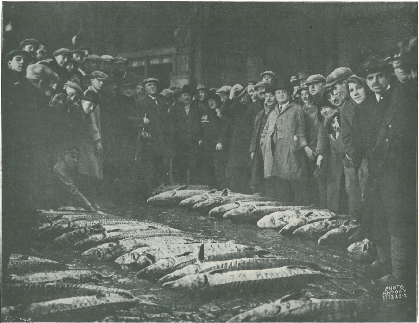
Vente de trente-deux esturgeons pêchés sur les côtes d'Espagne par le chalutier « Émile Vandervelde » de l'Armement ostendais.

Sous le régime de l'État belge, le délai de transport à l'intérieur, sauf de rares exceptions, ne dépassait pas un