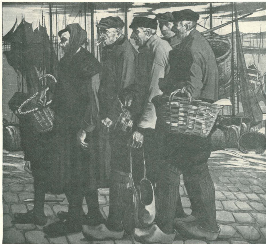
VAN SASSENBROEK. — Pêcheurs au repos,

de la Société coopérative « La Marine-De Zeevisch » et de l'Armement ostendais.