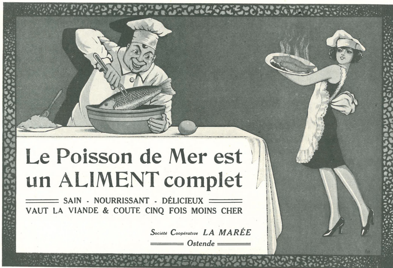
Affiche de propagande de la société coopérative « La Marée-De Zeevisch », à Ostende.

La vente se fait en outre à un prix fixe, valable pour tout l'hiver. Il faut, en effet, éviter les grandes fluctuations de