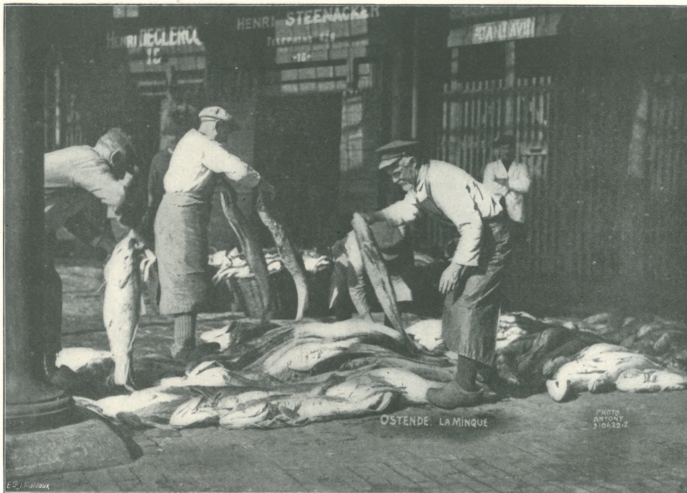
Un coin de la minque d'Ostende.

Nous avons dit déjà que la France, l'Allemagne, faisaient le transport rapide et à bon marché de cette denrée. La même