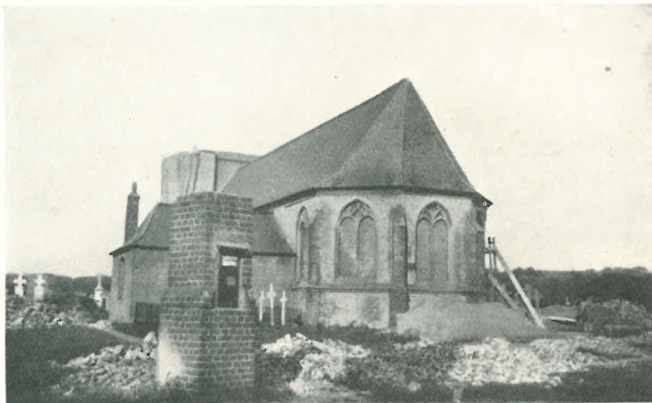
L'église en 1929.

à sa muraille où le Christ étend ses bras émaciés au-dessus des tombes de tant de générations de pauvres gens qui y dorment leur dernier sommeil; et on priait, dans ce site