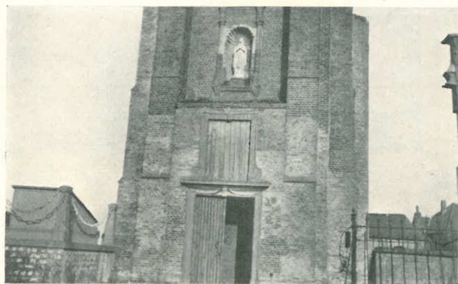
Onze Lieve Vrouw ter Streep en 1929.

Lorsqu'une compétence autorisée aura parfait cette restauration, quand un maître habile aura rafraîchi les