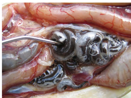
Zwemblaaswormen in de zwemblaas van een paling