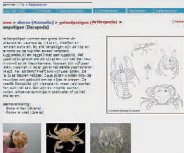
Hayward & Ryland 1990; Linnean Society of London