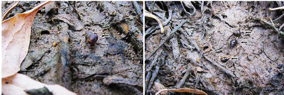
Foto 5 en 6: Baai van Heist, 10/9/2012 Assiminea grayana (Gray's kustslakje) (A. Anthierens)

meeegenomen en nadien zorgvuldig teruggezet. Het betreft een juveniel diertje van circa 2-2,5 mm hoog. Opmerkelijk dat zij tijdens het verdere intensieve zoeken niet meer aangetroffen werd. Het vermoeden echter dat andere exemplaren mogelijk over het hoofd waren gezien werd bevestigd door nieuwe vondsten. Tijdens een landslakkenexcursie van "Slak-in-du" troffen wij op 9 september, zo'n 50 à 60 m ten zuiden van de eerste vindplaats nog 1 levend juveniel specimen, eveneens onder zoutmelde, aan. Grondiger zoeken met Alfred de dag erop leverde een 20-tal grote volwassen exemplaren op. Weerom zaten zij telkens op de slibbodem onder dichte struiken van zoutmelde (foto 5), soms was het substraat ook bedekt met een korstvormend tapijt van halfopgedroogd blauwwier (Cyanophyta). In hetzelfde habitat zaten ook vrij veel wadslakjes. Aangenomen mag worden dat het kustslakje op deze wat meer landwaarts gelegen locatie in de Baai tamelijk algemeen doch verspreid, hoogstens met 3-4 exemplaren tezamen (foto 6), voorkomt.