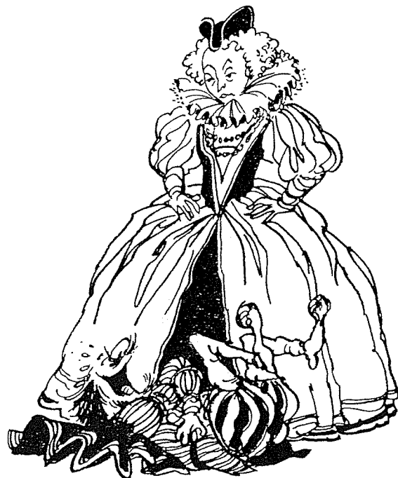
Marie de Médicis demandant l'heure à Concini

43b. Maria de' Medicis.- ... dus toen trouwde hij maar met Maria de' Medicis. Deze had niets anders dan last met haar minister Concini.