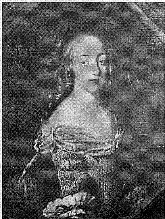
45a. Mme de Montespan.-Eigenlijk Françoise-Athénaïs marquise de Rochechouart, Schonk de koning zeven kinderen. Viel in ongenade en werd in een klooster gestopt. Ze raadde Louis haar vriendin de Maintenon aan.