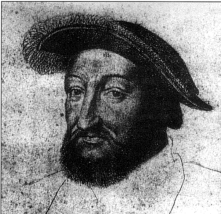
38. Frans I.- De koning van de pracht en de praal. Riep Leonardo da Vinci en Benvenuto Cellini aan zijn hof.

Frans I en Karel V sluiten een bestand om de veiligheid van onze vissers te verzekeren. Ook Frans I laat in zijn paleis Brugs tapijtwerk ophangen.