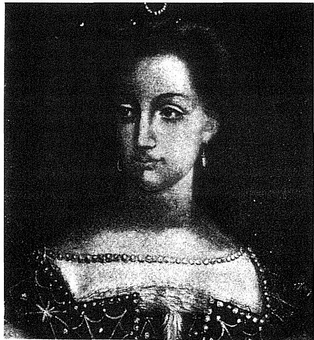
Diane de Poitiers en déesse-lune.

39a. Diane de Poitiers. Diane was al een hertogin van Valentinois voor ze als hofdame bij de koning in dienst kwam. Beeldschone weduwe op haar 31 ste . Had grote invloed op de koning. Hier als maangodin.