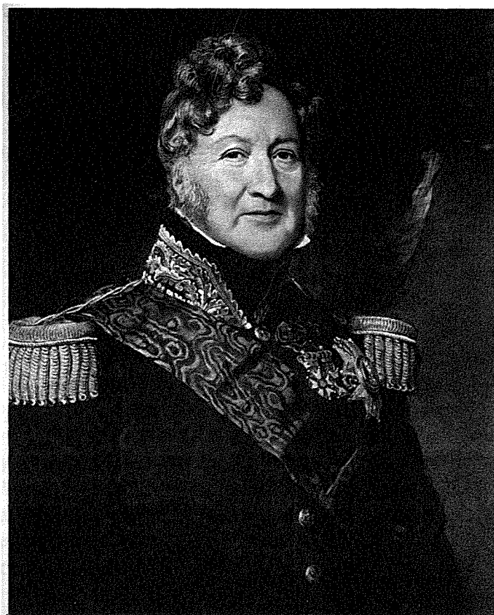
L. M. Louis Philippe, Roi des Français, 1841.

51. Lodewijk Filip < a.neef 46 1830 x Marie-Amélie