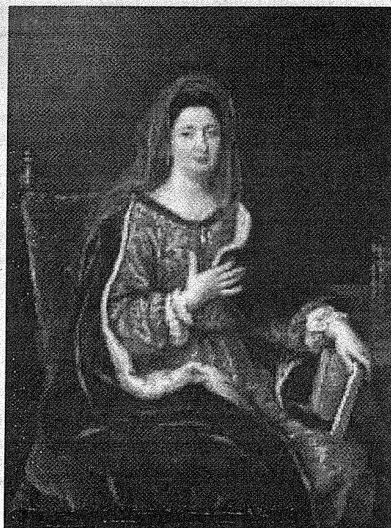
45b. Mme de Maintenon. - Eigenlijk Françoise marquise d'Aubigné met wie hij na de dood van zijn koningin een morganatisch huwelijk zou sluiten. Trok zich na zijn dood terug in een klooster. Stichtte scholen en