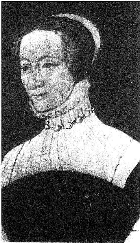
Marguerite de Navarre.

43c Margaretha van Valois, van Navarra of van Angoulême, zijn eerste echtgenote, zuster van Frans I. Stond op mystiek gebied onder invloed van onze Erasmus. Zeer literair aangelegd.