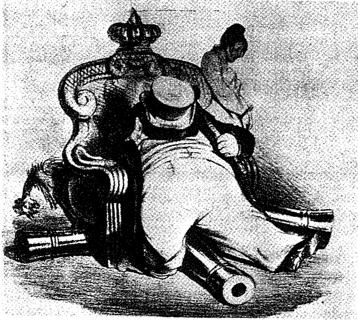
In Frankrijk is alles rustig. Karikatuur van Daumier, 1834 : Louis Philippe slapend op zijn troon.

51a. Er zou zich in Frankrijk niets voorgedaan hebben onder zijn regering. De encyclopediën denken er anders over. O, ja... Hij was wel de vader van onze eerste koningin Louise-Marie. Maar toen Leopold I hem militaire steun vroeg maakte hij er zich met een smoesje van af.