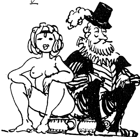
Henri IV et sa poule au pot

le vert galant = vrouwen- liefhebber le Vert Galant = Henri IV