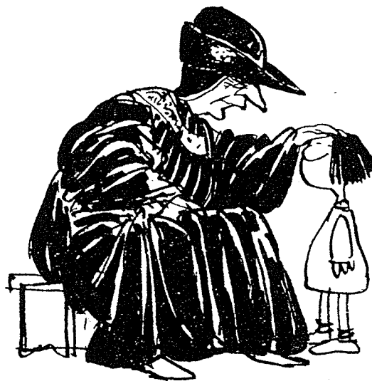
Louis XI et une fillette

35. Lodewijk XI.- Had het steeds aan de stok met Karel de Stoute... en met onze vissers.