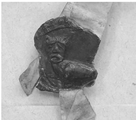
Afb. 2 Zegel van Wouter Reinfin, oudste bij naam bekende sluismeester van een watering in de Vlaamse kustvlakte (1277, watering Kamerlingsambacht) (RAB, Oorkonden met Blauw Nummer, 6752).

ken dat iemand die verkozen werd weliswaar verplicht was het ambt te aanvaarden, doch niet langer dan één jaar in functie diende te blijven. 71 Ook het feit dat de functie in de oudste reglementen als onbezoldigd wordt beschouwd, wijst in dezelfde richting. 72 Dit alles kan verklaren waarom we in de loop van de dertiende en veertiende eeuw sluismeesters aantreffen die behoren tot de lokale adel of de hogere clerus. 73 In de grote Blankenbergse watering, waar de clerus vanaf de veertiende eeuw recht had op een vaste vertegenwoordiger in het