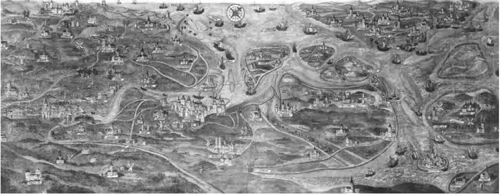
Afb. 1 Brugge, Groeningemuseum, inv. o. 1382, kaart van het kanaal van Oostburg en de Zwinstreek door Jan de Hervy, 1501.

dig blijkt in het door de tijdgenoot gehanteerde discours over waterbeheer. Hieruit zal ook blijken dat het besluitvormingsproces zowel evenementieel als structureel vaak complexer was dan het Kommunale of CPR-model kunnen bevatten. We hebben het daarbij in de eerste plaats over interne machtsverhoudingen binnen de plattelandsamenleving zelf. Gezien het belang van de interregionale handel voor de economie van het laatmiddeleeuwse Vlaanderen, hoeft het geen betoog dat ook vanuit stedelijke hoek nauwlettend werd toegekeken op het waterbeheer in de Vlaamse kustvlakte. De talrijke kanalen die de kustvlakte doorkruisten gaven aanleiding tot complexe problemen, waarbij stedelijke handelsbelangen gecombineerd met een vorstelijk centralisatiestreven meer dan eens botsten met de verlangens van landbouw en plattelandsamenleving inzake afwatering en zeekeringen. 49