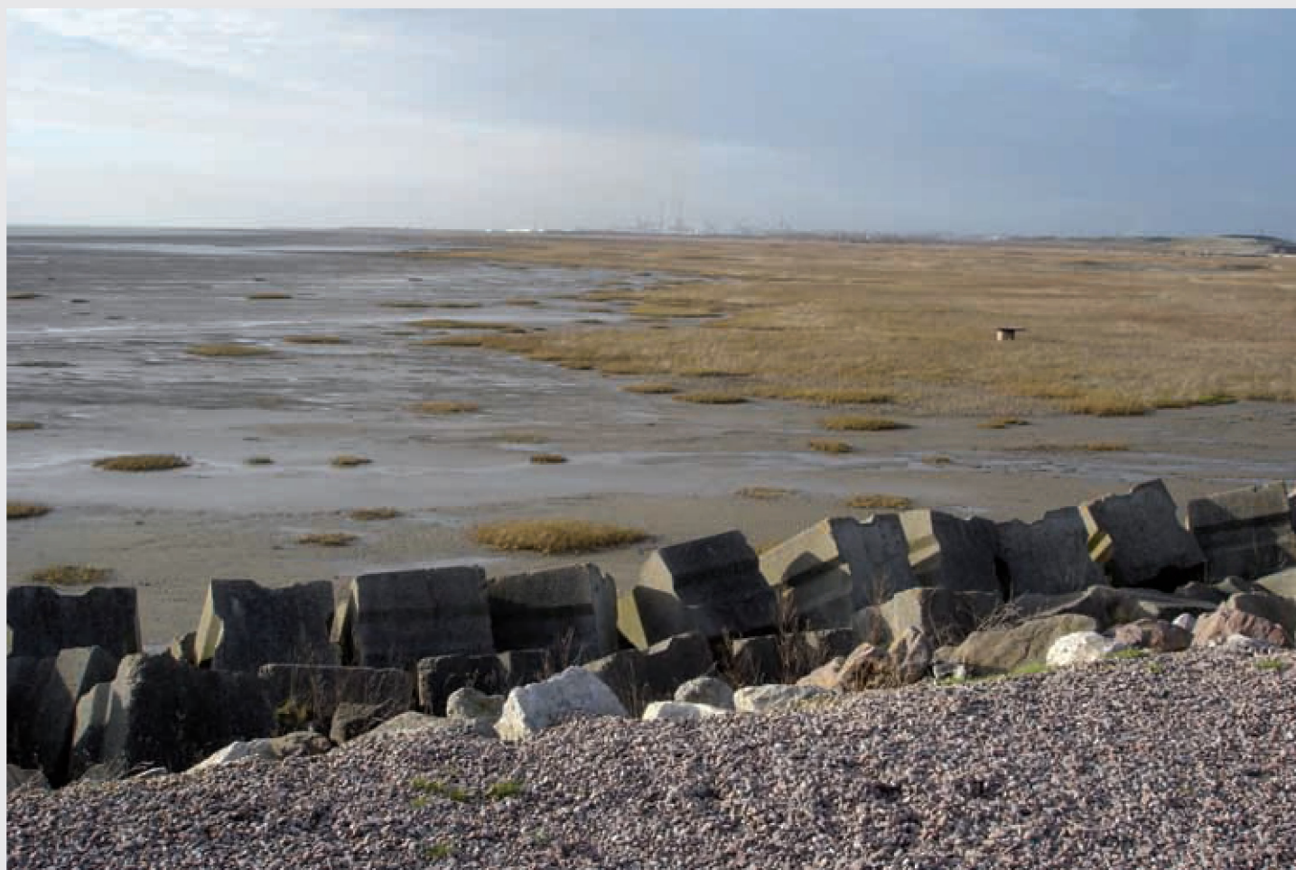
■ Estuarium van de Seine (HS)