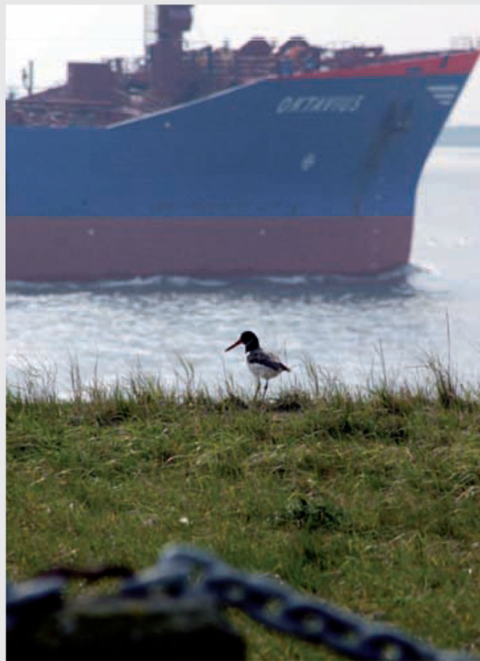
■ Scholekster in het havengebied van Antwerpen (HvA)

De Europese Commissie is ervan overtuigd dat dit soort samenwerkingsprojecten - dat zoekt naar een nieuwe balans tussen havenconomie en havenecologie - meehelpt om nationale grenzen van hun barrièrewerking te ontdoen. "Regio's raken met elkaar verbonden, van de resultaten profiteert de hele EU." De Europese Commissie vindt dit,