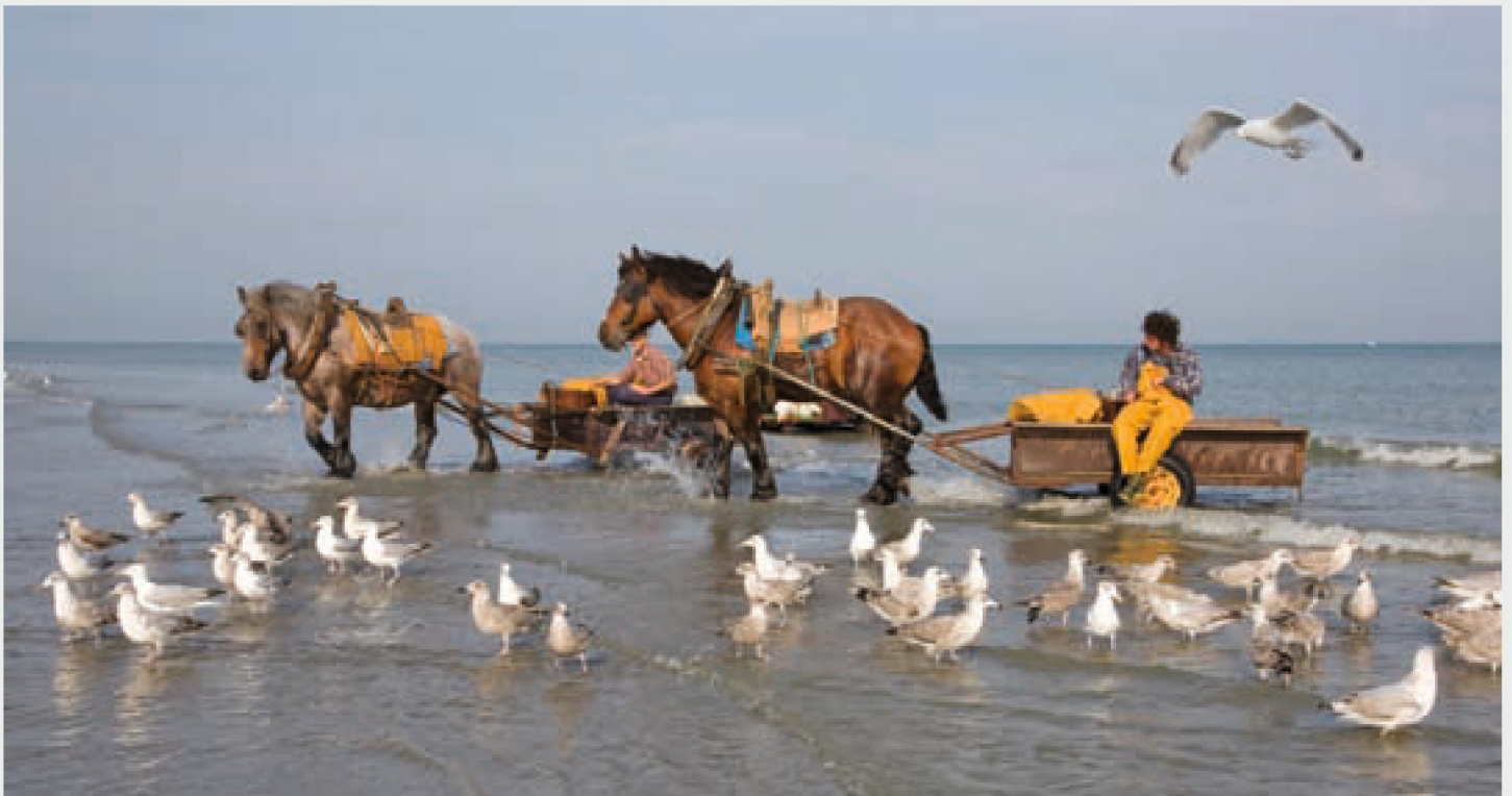
De garnaalvisserij te paard werd eind 2013 toegevoegd aan de UNESCO-lijst voor Immaterieel Cultureel Erfgoed van de Mensheid (MD)