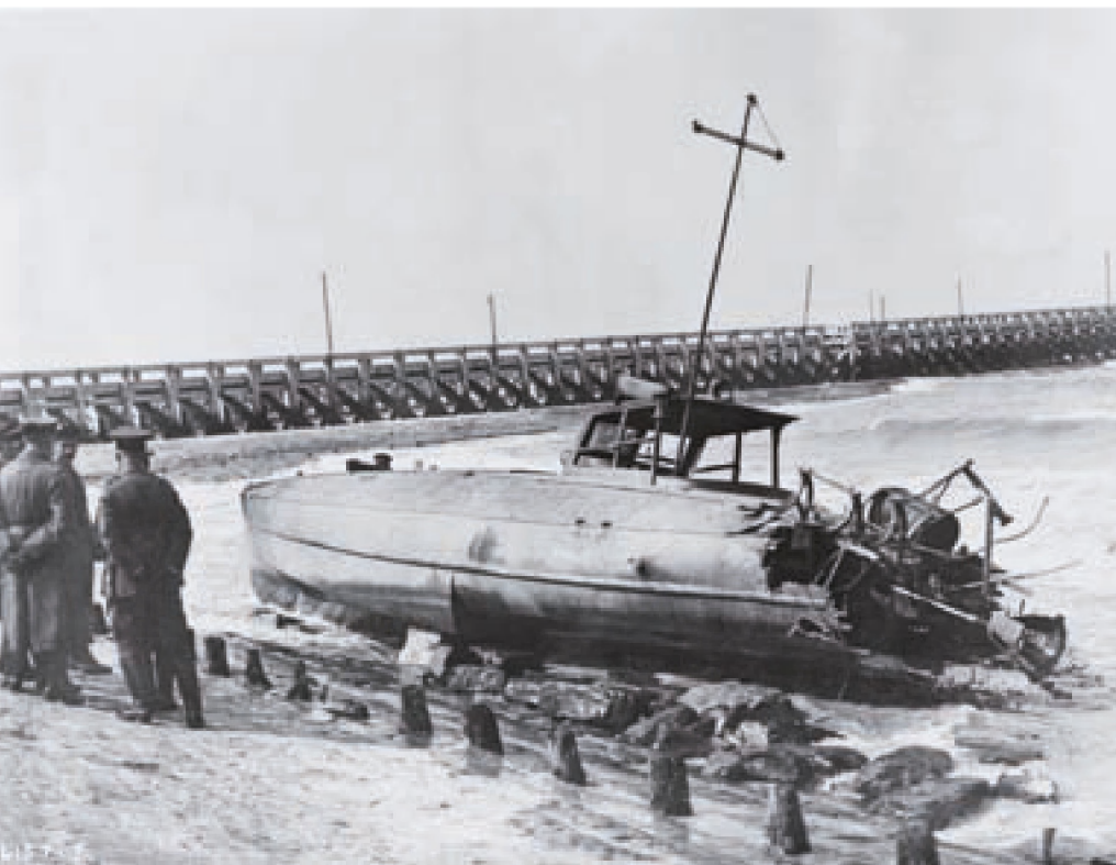
■ Britisches 'Coastal Motor Boat' 33A, gestrandet in Oostende, Frühjahr 1918

den Erhaltungszustand der 18 gekannten und verbliebenen Wracks aus dem Ersten Weltkrieg betrachten, fällt gleich auf, dass vor allem die deutschen Schiffswracks gut erhalten sind. Sie bilden auch die zahlenmäßig größte Gruppe. 2/3 davon sind gut oder ziemlich gut erhalten. Es geht an erster Stelle um einige U-Boote, die dank ihrer soliden Konstruktion eine bessere Chance haben, in gutem Zustand zu bleiben: die U-11, UB-10, UB-13, UB-20, UB-59, ein U-Boot der Klasse UB-III, die UC-4 und die UC-62. Daneben sind 2 Torpedoboote (G-88 und G-96) sowie 3 Vorpostenboote ('Senator Holthusen', 'Senator Sthamer' und 'Frigg') ziemlich gut erhalten.