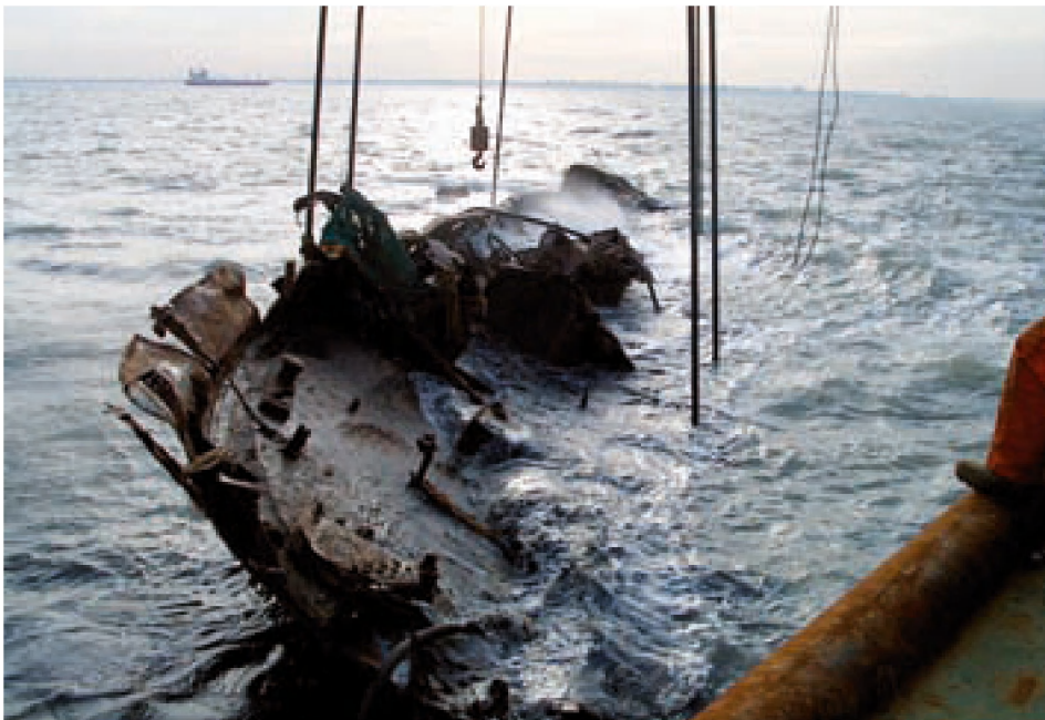
■ Die SMS Prangenhof wurde im Jahre 2002 an die Oberfläche gebracht

markiert wurden. Diese Inschriften sind von großer wissenschaftlicher und kultureller Bedeutung und können als die älteste hydrometrische Station der Welt (Ge Xiurun 2010) betrachtet werden.