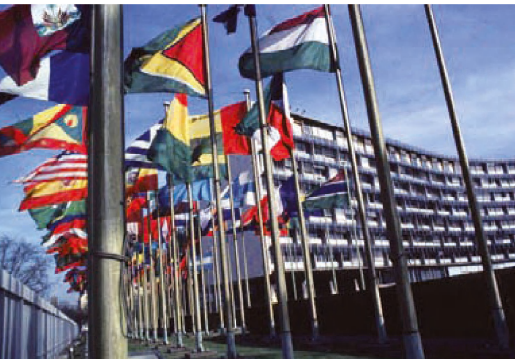
■ Der Hauptsitz der UNESCO in Paris (UNESCO)

Die Staaten, die die Konvention ratifizieren, treten sozusagen einem Klub von Ländern bei, die sich dazu verpflichten wollen, das Unterwasser-Kulturerbe zu erhalten und sich dabei, wenn nötig, gegenseitig zu unterstützen. Die Zusammenarbeit kann verschiedene Formen annehmen. Die Vertragsstaaten werden zum Beispiel dazu aufgefordert, im Rahmen spezifischer Situationen/Fälle gegenseitige Abkommen abzuschließen. Ein wichtiger Aspekt der Zusammenarbeit betrifft den Austausch von Informationen, wobei der Generaldirektor der UNESCO eine Mittlerrolle übernimmt. Die Vertragsstaaten der Konvention treten auch mindestens alle zwei Jahre zusammen. Eine ‘nachprüfbare Verbindung’ zum Unterwasser-Kulturerbe in den Meeresgebieten eines anderen Vertragsstaates reicht für einen Vertragsstaat, um eine formelle Kooperation mit diesem anderen Vertragsstaat einzugehen. Die Konvention regelt das Eigentumsrecht nicht, erlaubt unter bestimmten Bedingungen Bergungen und ist auch in vollem Umfang auf Wracks von Schiffen im Staatsbesitz (wie zum Beispiel Schiffswracks aus dem Ersten Weltkrieg) anwendbar.