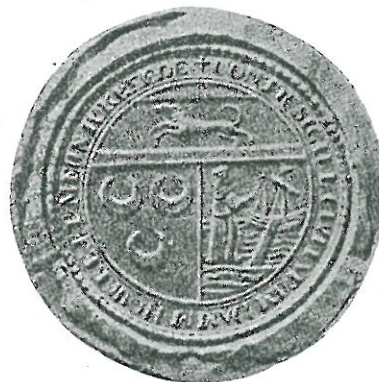
Zegel van de vereenigde steden Damme, Monnikerede en Hoeke. (XVIII e eeuw. Museum Gruuthuse, Brugge).

De Lembeeksche Weg stond ook in verbinding met de Markt, door het Visschersstraatje, dat in de Roostraat uitliep.