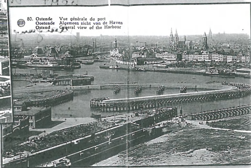
80. Ostende Vue générale du port Oostende Algemeen zicht van de Haven Ostend General view of the Harbour

weken later wordt er dan ook rechtstreeks zeewater toegelaten in het dok.