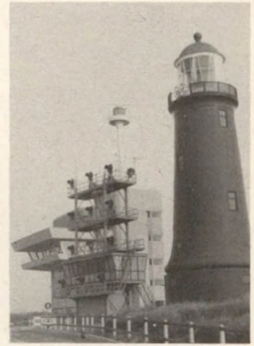
Kustwachtcentrum Umuiden

Eind 1990 is de reeds lang verwachte MER lozing van oliehoudende mengsels in de mijnbouw op zee uitgekomen. Het resultaat is omvangrijk. In een tiendelige rapportage worden de effecten van lozing van oliehoudend boorgruis en oliehoudend produktiewater aangegeven. Zoals eigenlijk al langer bekend was, blijken de effecten van de lozing van oliehoudend boorgruis in de omgeving van boorplatforms desastreus. Op ruim honderd hectare bodemoppervlak nabij het boorplatform wordt het bodemleven beïnvloed. Ook vinden er aanzienlijke olielozingen plaats bij de productie van olie en gas. In de huidige situatie kan (en mag) er bij olieproductieplatforms een olievlek ontstaan. In het water is er in de huidige situatie tot op een aantal kilometers afstand vanaf een olieplatform