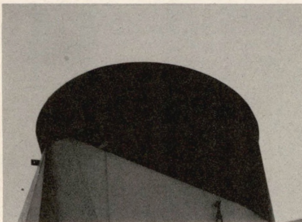
luchtvervuiling door scheepvaart