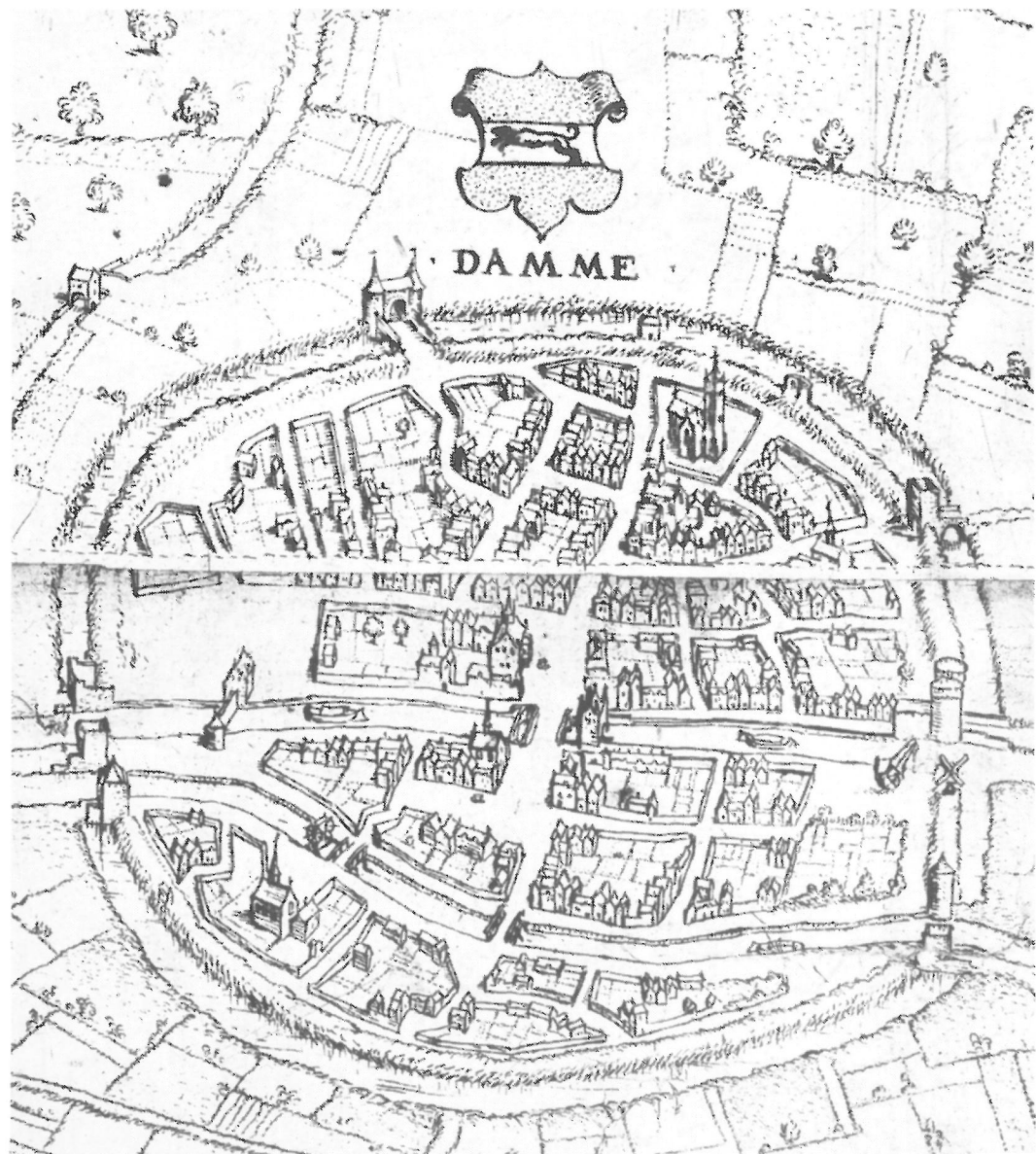
Afb. 2. Stadsplan van Damme, uit het plan van Brugge door Marcus Gerards, 1562. Zie de scellemeulen en de kraan nabij de Kleine Brugse poort, rechts op de kaart. Links : de Sluisse poort of Kranepoort (plaats van de oudste kraan : die van 1269).