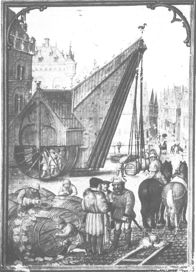
Afb. 1. De middeleeuwse houten wijnkraan te Brugge. Miniatuur, voorkomend in het getijdenboek van omstreeks 1515 toegeschreven aan Simon Bening, miniaturist uit Gent. München, Bayerische Staatsbibliothek, Cod. Lat. 23633, f° 11 v°.