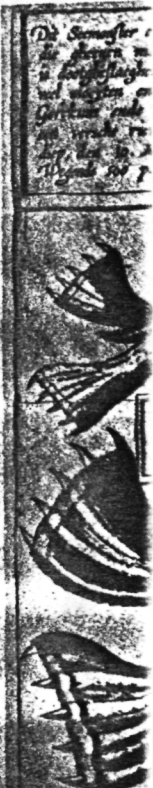
De zeehonden vro jonge zeehond in

Aan het eind van de eeuw komt het instellen van premie opnieuw aan de orde. De Zeeuwse bezwaren tegen het premiëstelsel waren dat deze regeling vroeger niet tot een geregelde jacht had geleid. Een