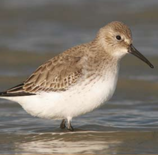
Bonte strandloper - Koen Devos