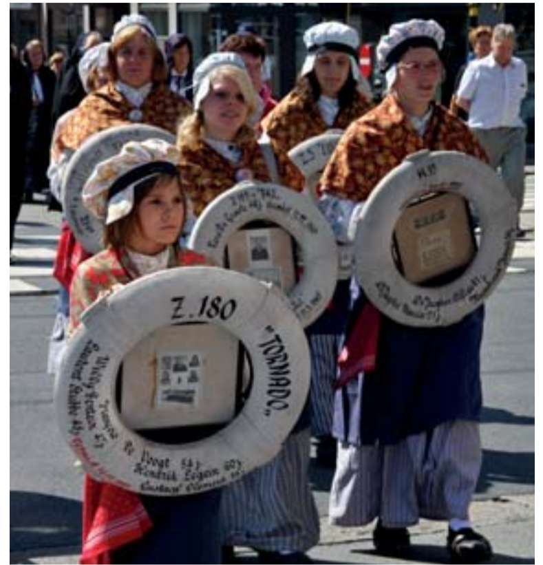
In Heist dragen de Klakkertjes de boeien met de namen van de overleden vissers. (2008)

De geschiedenis van de zeezegeningen en vissersmissen laat zich sowieso niet lezen als een constant