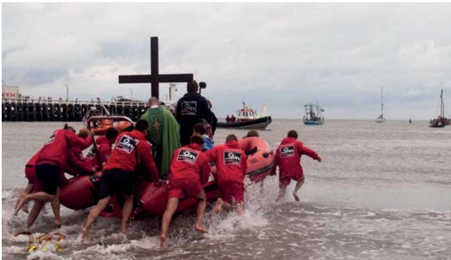
In Blankenberge gaat de deken met de redders op zee. (2014)

De vissersmissen en zeezegeningen zijn niet de enige vorm van volksdevotie aan de kust: in vissersmidens worden ook andere gebruiken in ere gehouden. Zo trekken mensen uit de vissersgemeenschap nog vaak naar een visserskapelletje om te bidden of een kaarsje voor dierbare overledenen te ontsteken. Dergelijke kapellen zijn te vinden in Koksijde, Nieuwpoort, Lombardsijde, Wenduine en Heist, al is de bekendste zonder twijfel die van Bredene. In het verleden was het ook gebruikelijk om in deze kappelletjes ex voto's te offeren. Het schenken van zulke kleine voorwerpen in was of zilver had net hetzelfde doel als het uitspreken van een zegen over de zee: het was een manier om God te vragen om over de vissers te waken. Op bedevaart gaan naar de kapel was dan weer een manier waarmee vissers God bedankten als ze ongehavend uit een storm kwamen. Tegenwoordig offert de vissersgemeenschap geen ex voto's meer; de vissersbedevaarten zijn er wel nog steeds.