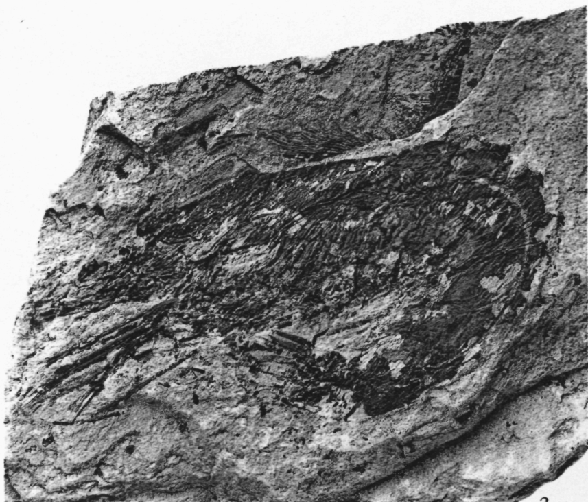
Penaeus smithwoodwardi (x 1)