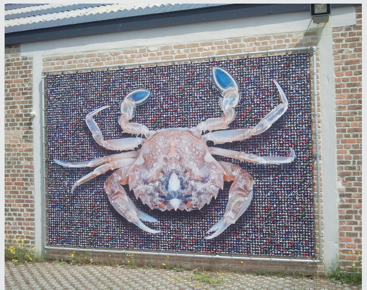
Deze krab, een kunstwerk van Wim Tellier, staat symbool voor de ecologische voetafdruk op onze planeet en is te bewonderen op de westgevel van het Marien Station Oostende (VLIZ)