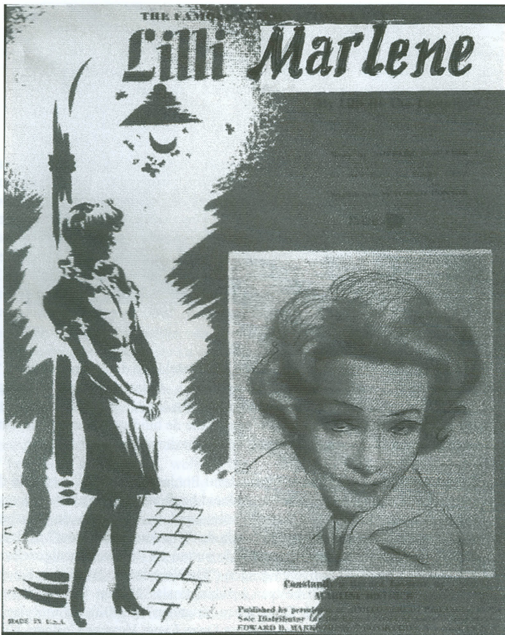
Engelse versie van Lily Marleen (1943)