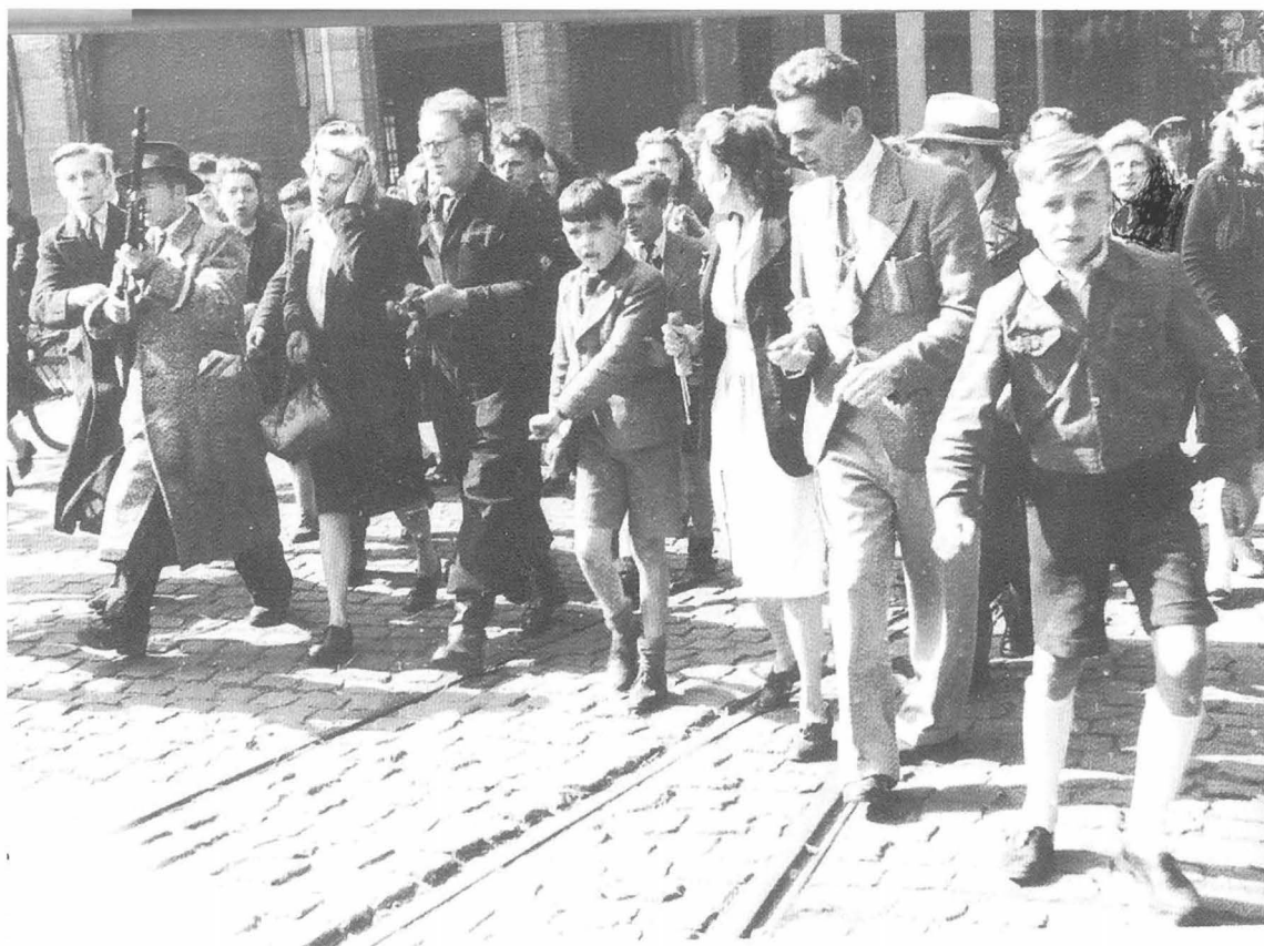
Collaborateurs worden opgepakt