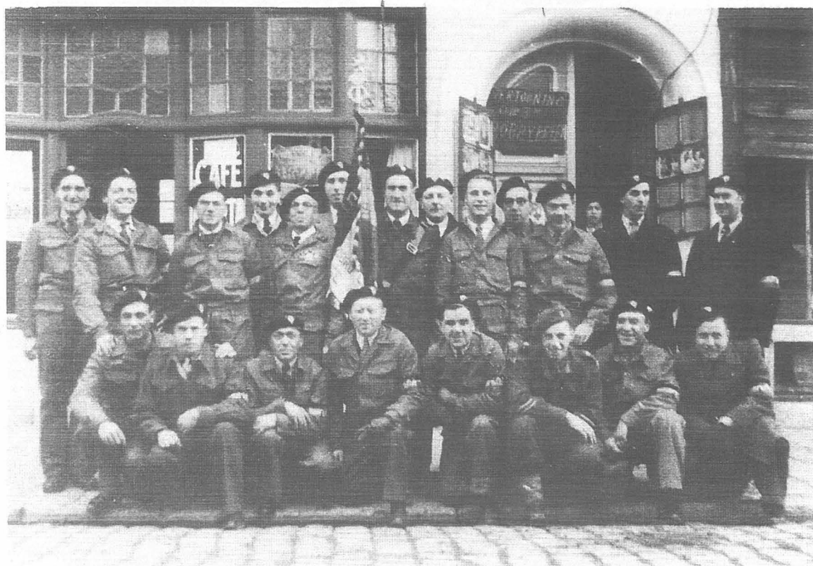
De Oostendse afdeling van het Geheim Leger