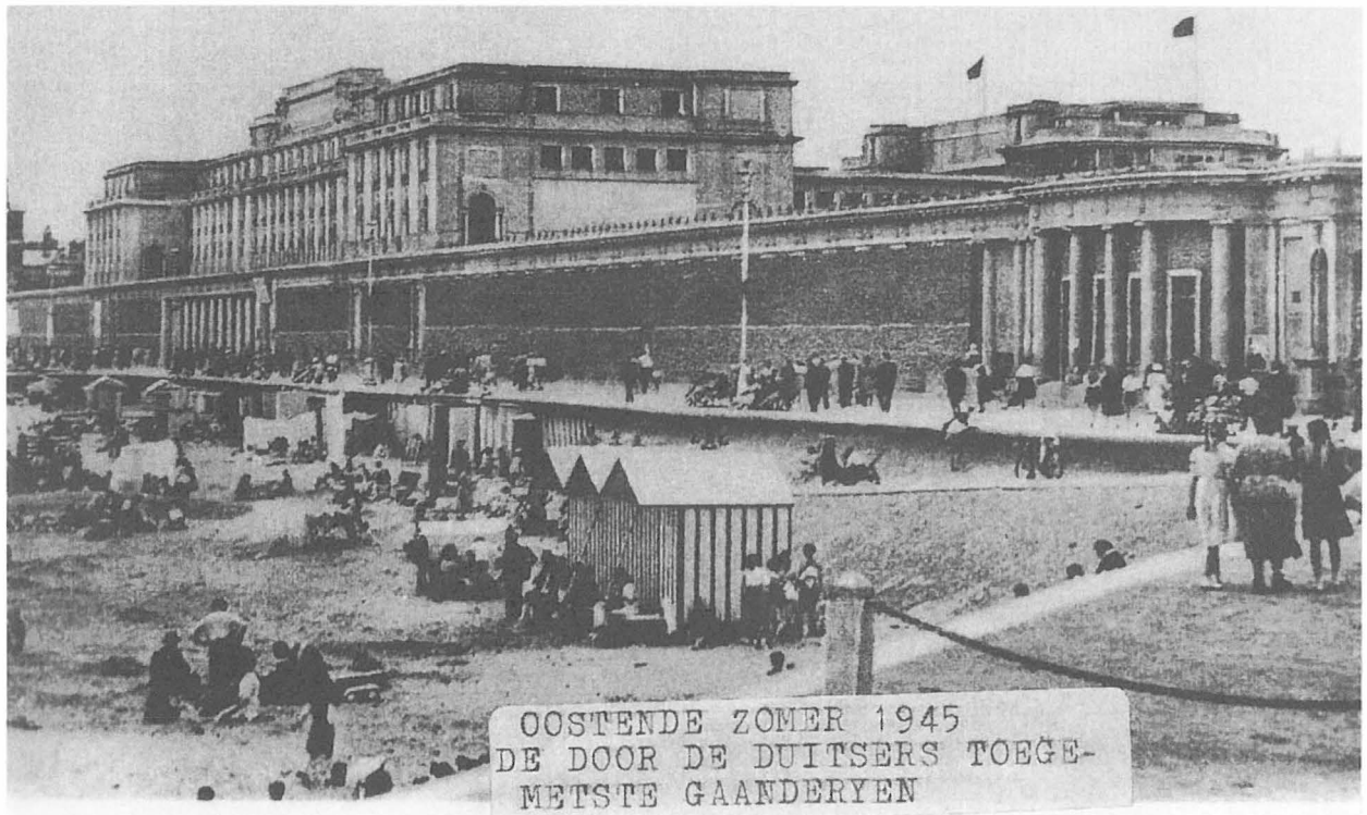
Naoorlogse zeedijk, zomer 1945

Voor de historicus zijn die processen van Nürnberg qua bronnenmateriaal een onschatbare bron van informatie en documentatie. Want zonder een spijkerhard dossier kon de openbare aanklager weinig aanvagen (de aangeklaagden hadden uiteraard recht op verdediging en hun advocaten waren niet de eerste de beste en zeer gemotiveerd!). Maar in spoedtempo en in die naoorlogse omstandigheden zo'n dossier samenstellen was niet zo evident, wel integendeel! (de nazi's hadden hun uiterste best gedaan om nog tijdig alle sporen van hun misdaden uit te wissen door niet alleen lijken maar ook dossiers te verbranden). Precies omdat na 1918 de oorlogsmisdaden geen justitiële gevolgen hadden, met een eeuw later nog niet eens een spijtbetuyging of verontschuldiging (maar met tijdens het interbellum veel misbaar omtrent beuzelarijen en herstelbetalingen!), was in het herdenkingsjaar 2014 hierover weinig echt bronnenmateriaal voorhanden ...en kan men nog steeds een eindeloos debat voeren over kwesties die normaliter allang door historici hadden moeten zijn opgehelderd, en waarbij sommige "bestseller"-historici zelfs nog een (duidelijk commercieel getint) sensationeel "spelletje" weten op te voeren! Pecunia non olet!