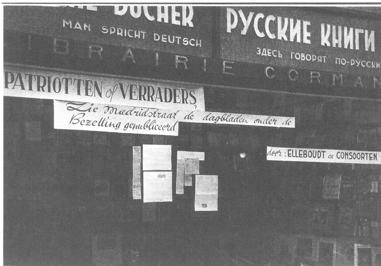
Boekhandel Corman dadelijk na de bevrijding