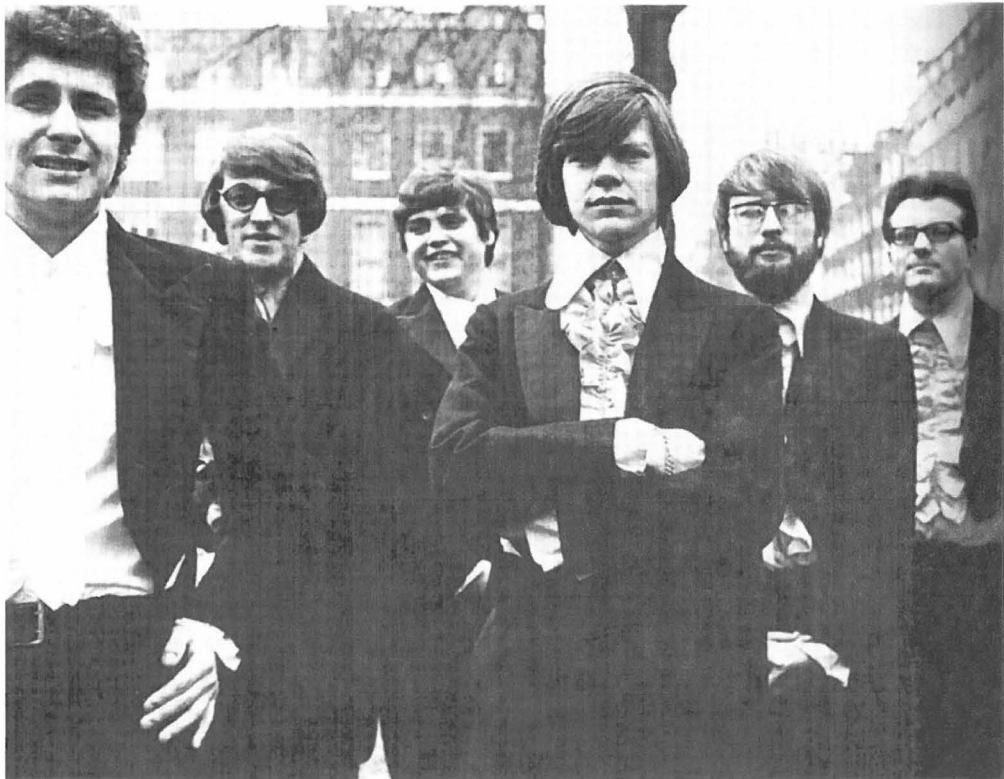
The Wallace Collection