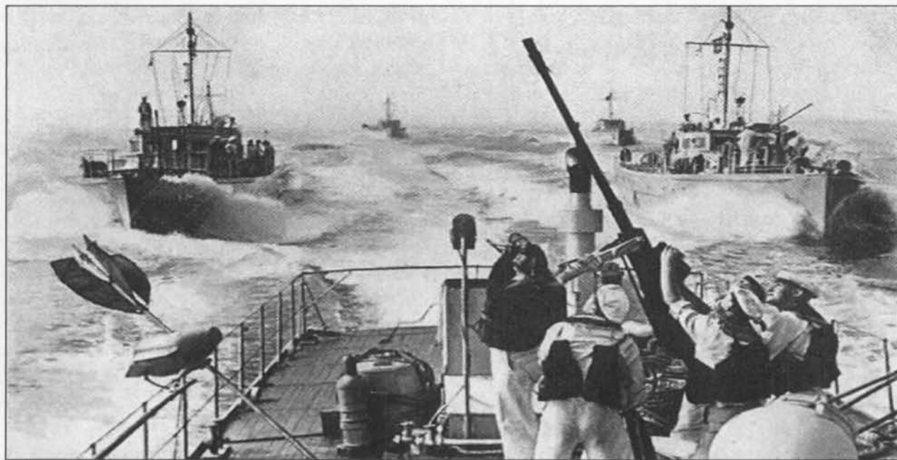
Minenräumbootflottille op oefening.