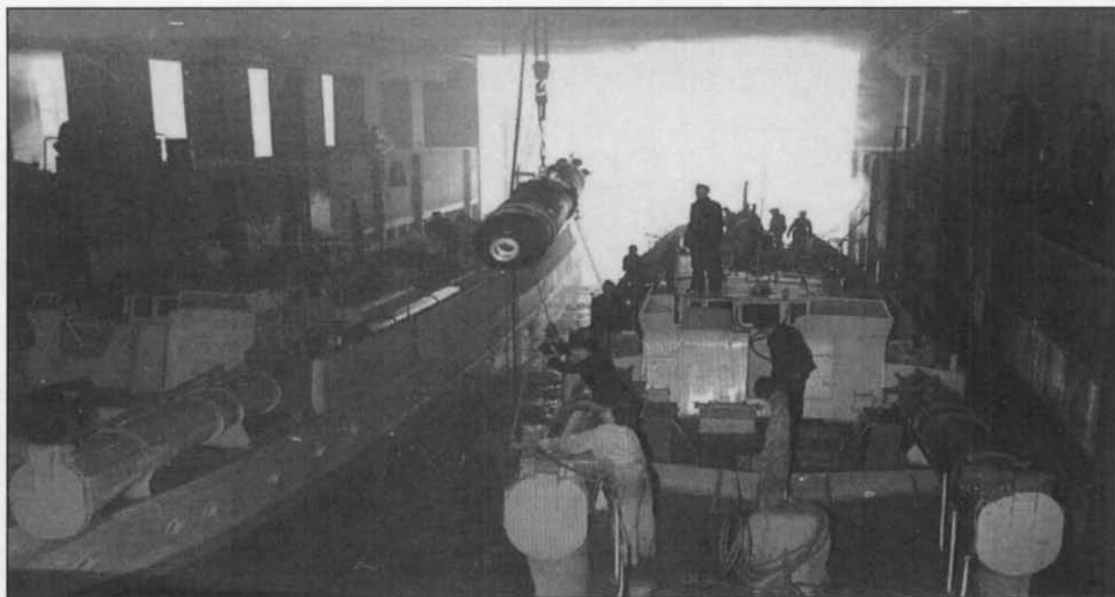
Het laden van een torpedo in de snelbootbunker

Onmiddellijk na hun aankomst richten ze 'Stützpunktgruppe Ostende' (steunpuntgroep Oostende) op. Kapitein-ter-zee Johannes Schneider wordt haar eerste commandant en tezelfdertijd havencommandant. Hij oefent deze functie uit van augustus 1940 tot de bevrijding van onze stad in september 1944. In december 1940 beginnen de Duitsers aan de bouw van een snelbootbasis. Meerdere snelbootflottieljes verbleven tijdelijk te Oostende en losten er elkaar af. Het waren de 2 e , 3 e , 4 e , 5 e , 6 e en 8 e flottieljes. Oostende wordt ook de basis van een Minensuch (MS), Räumboot (R), Sperrbrecher (S), Vorposten (VP), Hafenschutz (HS) en Unterseebootjagdflottille . Deze flottieljes maken samen het Küstensicherungsverbande (kustbeveiligingseenheid) uit. Het geheel staat onder bevel van vice-admiraal Friedrich Ruge.