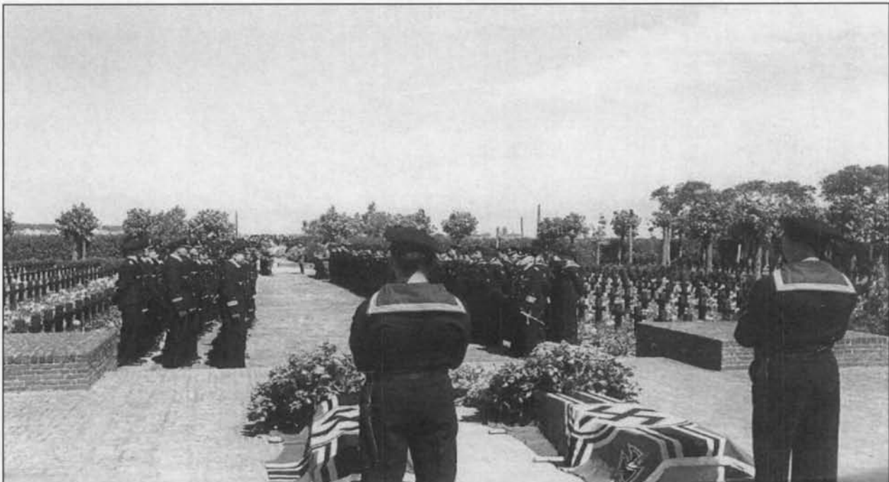
Begrafenisplechtigheid op het Duitse militair kerkhof te Oostende

Alle gesneuvelden worden zoals gebruikelijk met militair eerbewijs bijgezet op het Duitse militair kerkhof te Oostende en vanaf 08 augustus 1949, overgebracht naar het Duitse Ehrenfriedhof (een verzamelkerkhof) 1940-45 te Lommel (Limburg). Daar liggen in 2001 reeds 39094 gesneuvelden.