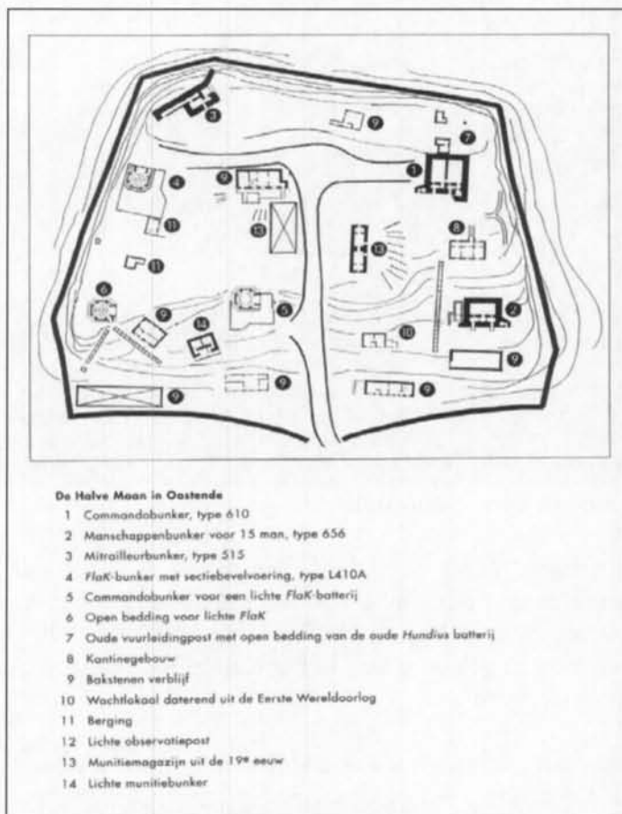
Stützpunkt Hafen – De halve maan.