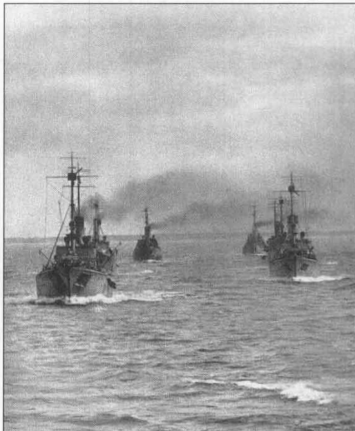
De voorpostenbootflottielje loopt uit.

Op 05 April 1943 wordt vóór Nieuwpoort een Hafenschutzboot van Oostende in echte commandostijl door eenheden van de Engelse marine geënterd. Ze nemen de bemanning krijgsgevangen en steken de boot in brand.