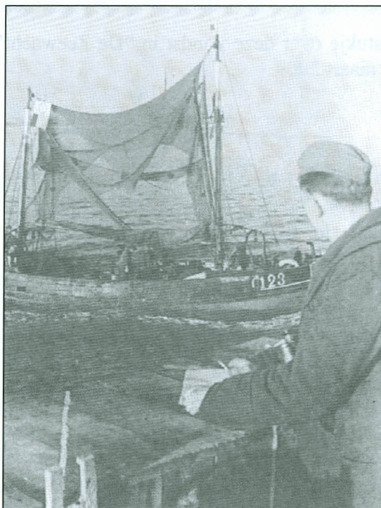
Personeel van de Hafenüberwachungsstelle controleert het binnenvaren van de O.23.