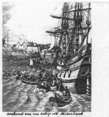
aankomst van een schip uit Nederland

Een nogal “curieuze” maar toch interessante bron van inlichtingen in die periode zijn de rapporten die de Staatse belastingontvanger Everwyn plichtsgetrouw regelmatig zond naar Den Haag.