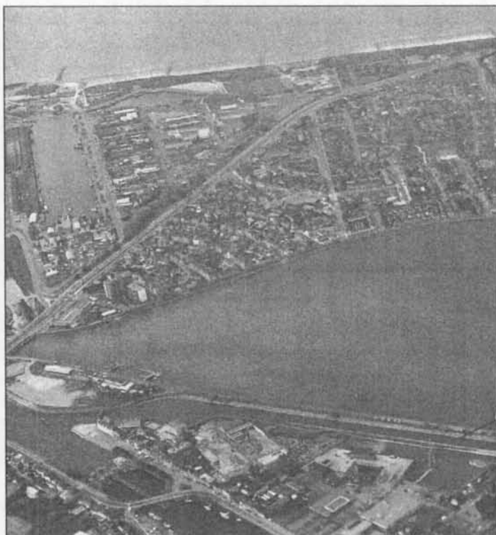
Panorama van de Vuurtoerenwijk

In de nacht van zaterdag 07 op zondag 08 september vallen bommen in het spergebied en rond de Vuurtoerenwijk. Zo ook in de nacht van zondag 08 op maandag 09. In de Thomas Vanloostraat wordt een huis totaal vernield.