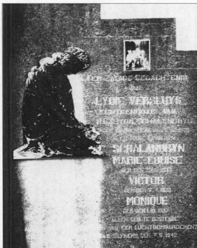
Grafteken van slachtoffers van het bombardement van 07 mei 1942 op de elektriciteitscentrale van Bredene-Oostende.

St.Idesbald overgebracht waar hij nog dezelfde dag overlijdt. Het vliegtuig maakt deel uit van een formatie van zes die als opdracht heeft de elektriciteitscentrale van Bredene-Oostende te bombarderen. Deze opdracht mislukt. Sergeant Handford ligt te Oostende begraven op het ereperk van het kerkhof Stuiverstraat.