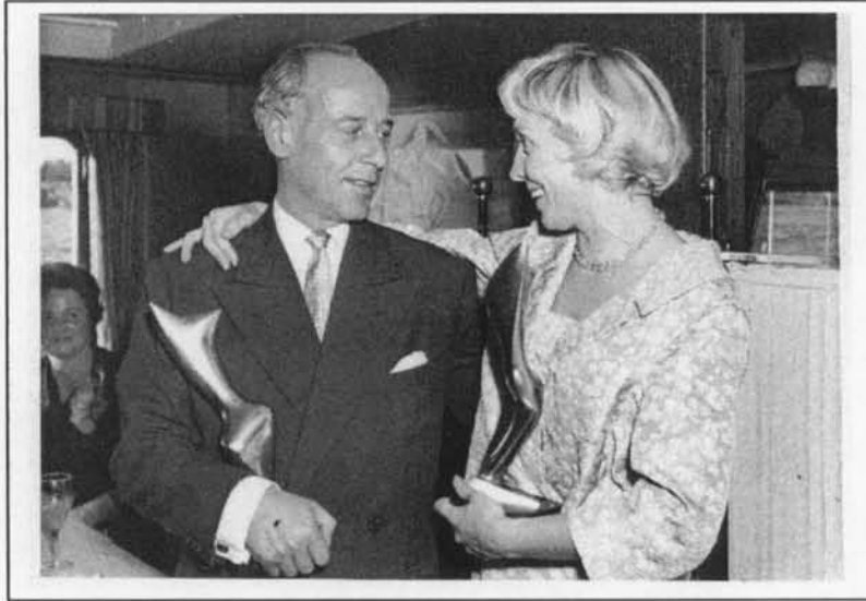
Tijdens de uitreiking van de Theatron-Prijs 1958