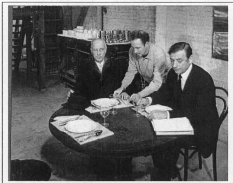
Tijdens de opnamen van "Un soir, un train" met André Delvaux (midden) en Yves Montand (rechts)