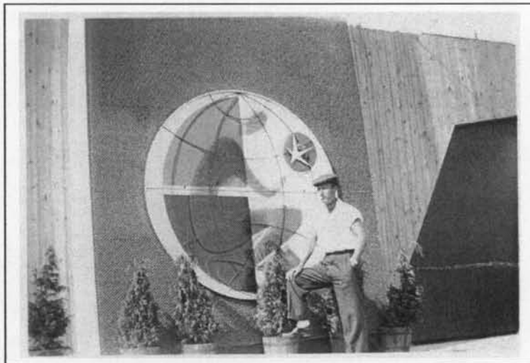
Tijdens de opnamen van "Het geluk komt morgen" in 1958