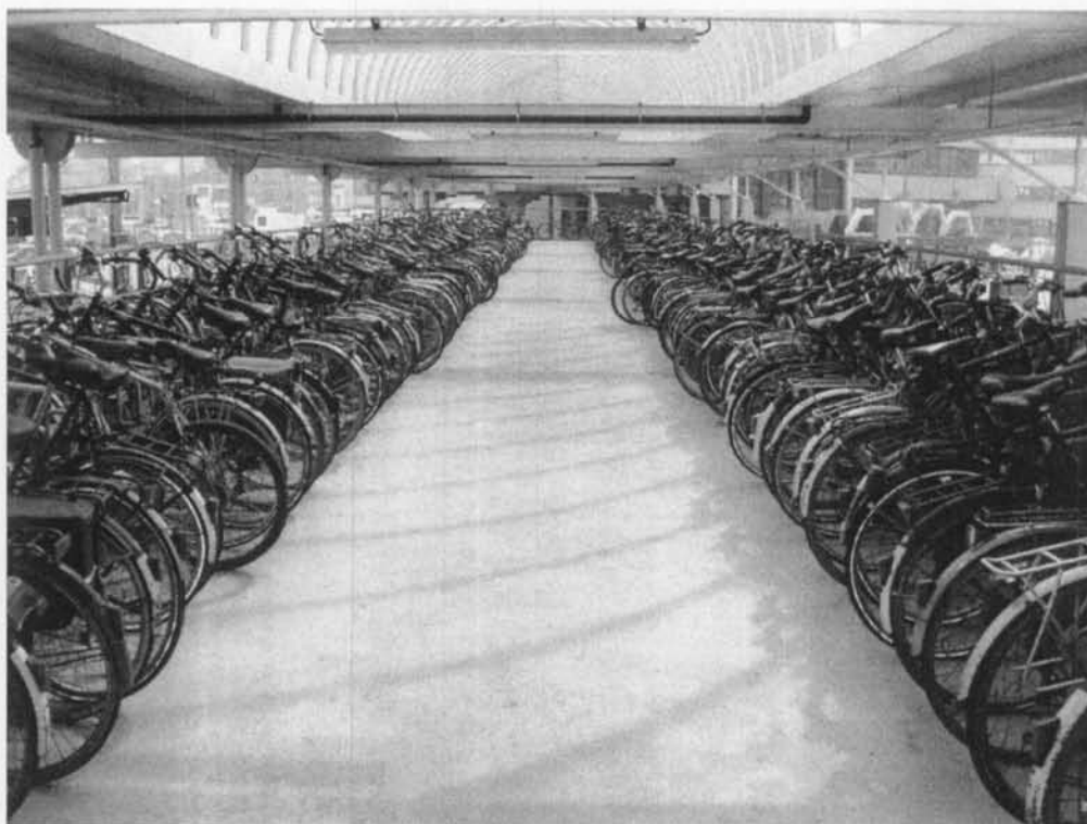
Fietsenbergsplaats op gelijkvloers