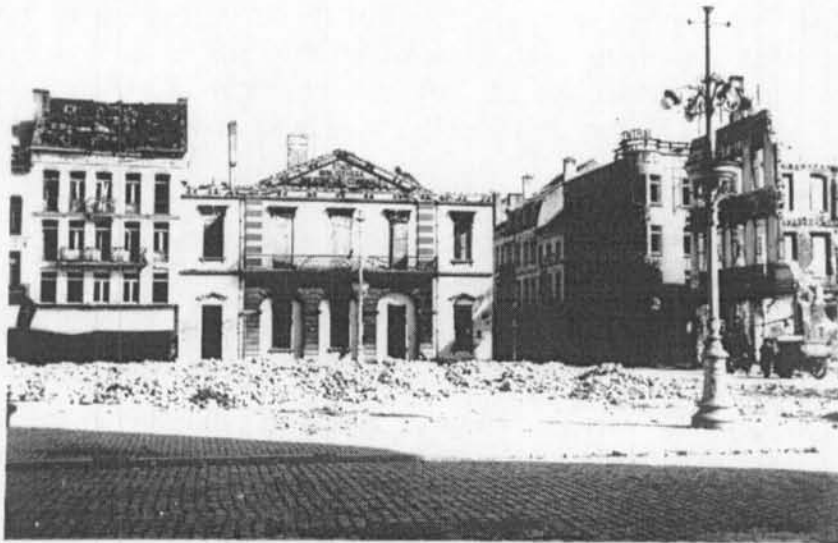
Oostende, einde mei 1940. Wat een verwoestingen, ook op het Wapenplein. Bekijkde uitgebrande Stadsbibliotheek en het gespaarde Hotel-Café "Central" te midden van zwaar geteisterde gebouwen en alom puinen.