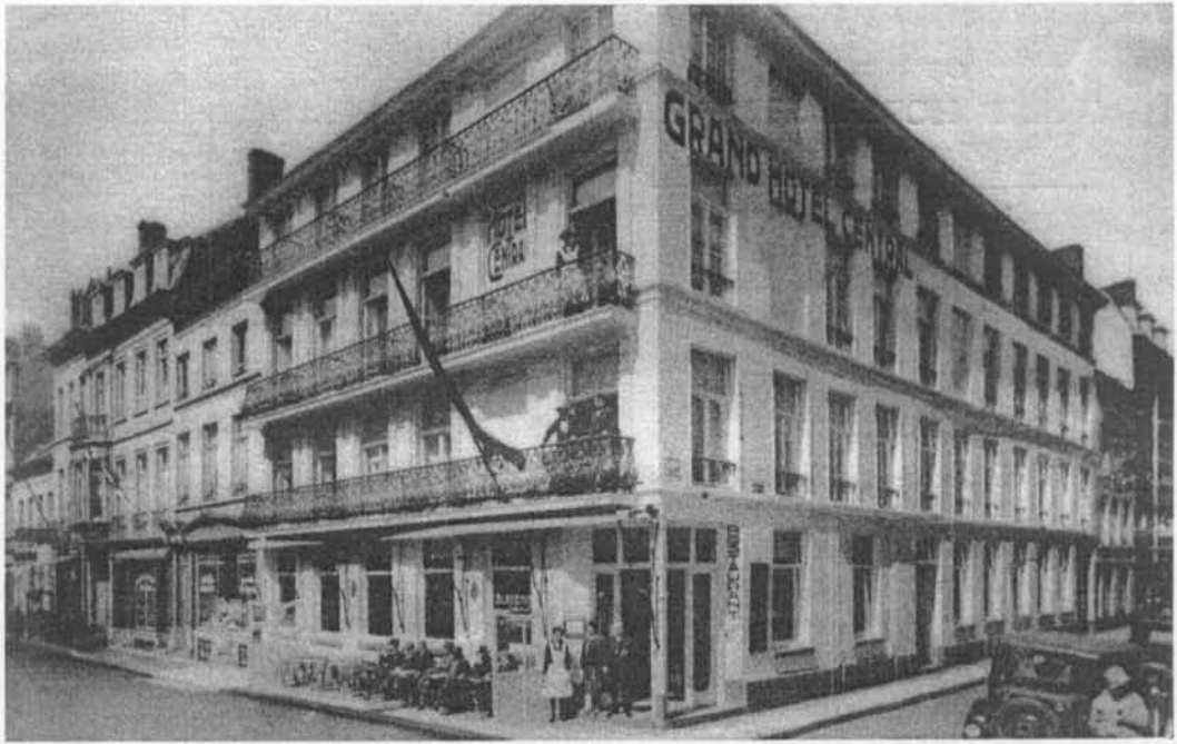
Een vierde prentkaart die ik situeer in de twintiger jaren, prijst het Hotel en het Restaurant aan. Tussen de tweede en de derde verdieping staat "Grand Hôtel Central" geschilderd, goed zichtbaar vanop het Wapenplein. Bemerkt de vlaggenstok, toen nog volop in trek, op de hoek.