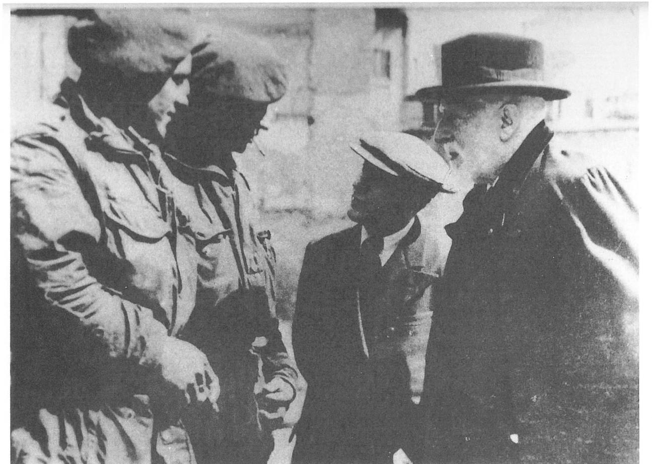
Ensor in gesprek met Canadese soldaten