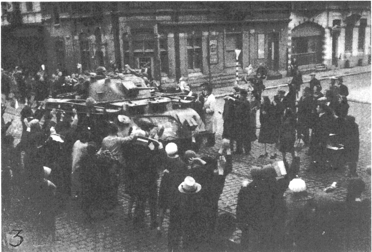
Café "Le Châtelet": Canadezen naderen Petit Paris