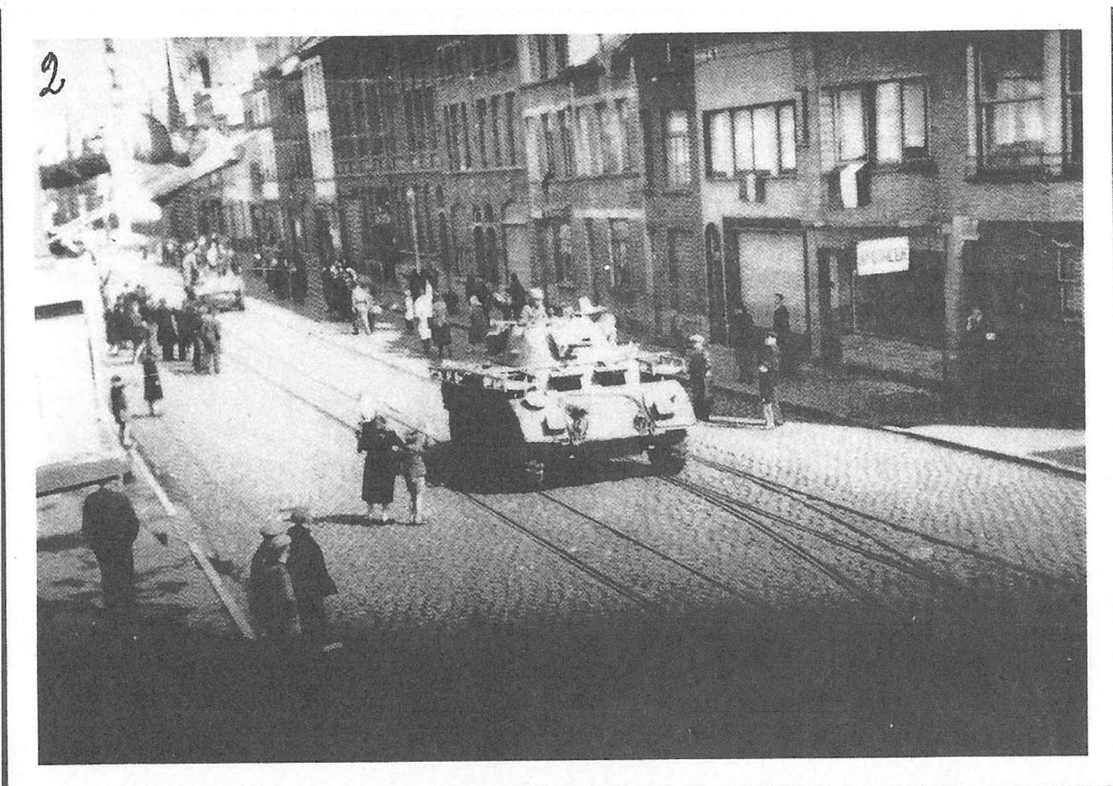
Nieuwpoortsesteenweg: eerste Canadese tanks, eerste toeschouwers en Belgische vlaggen