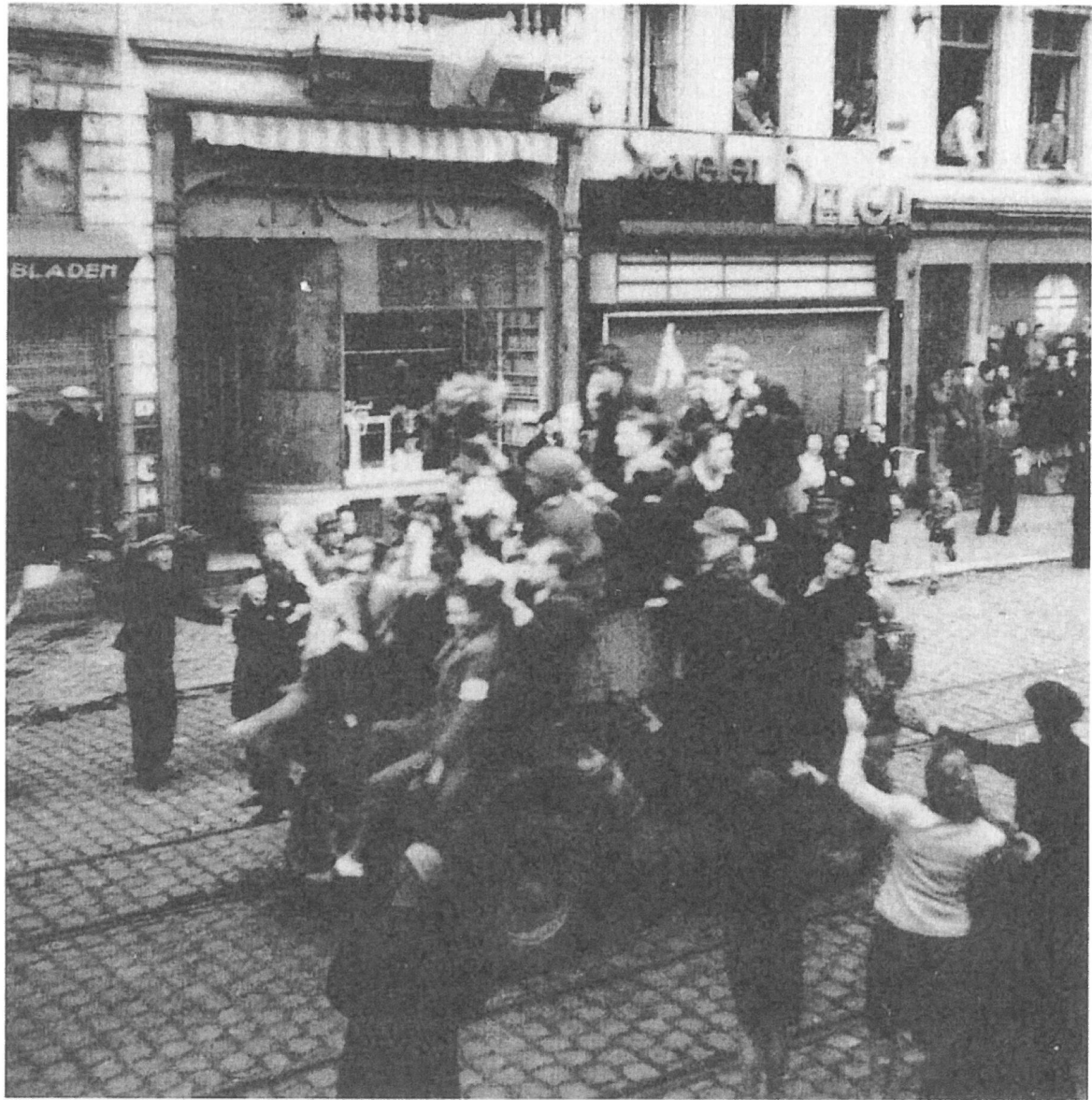
Kruispunt Petit Paris: “blijde intocht” via Alfons Pieterslaan