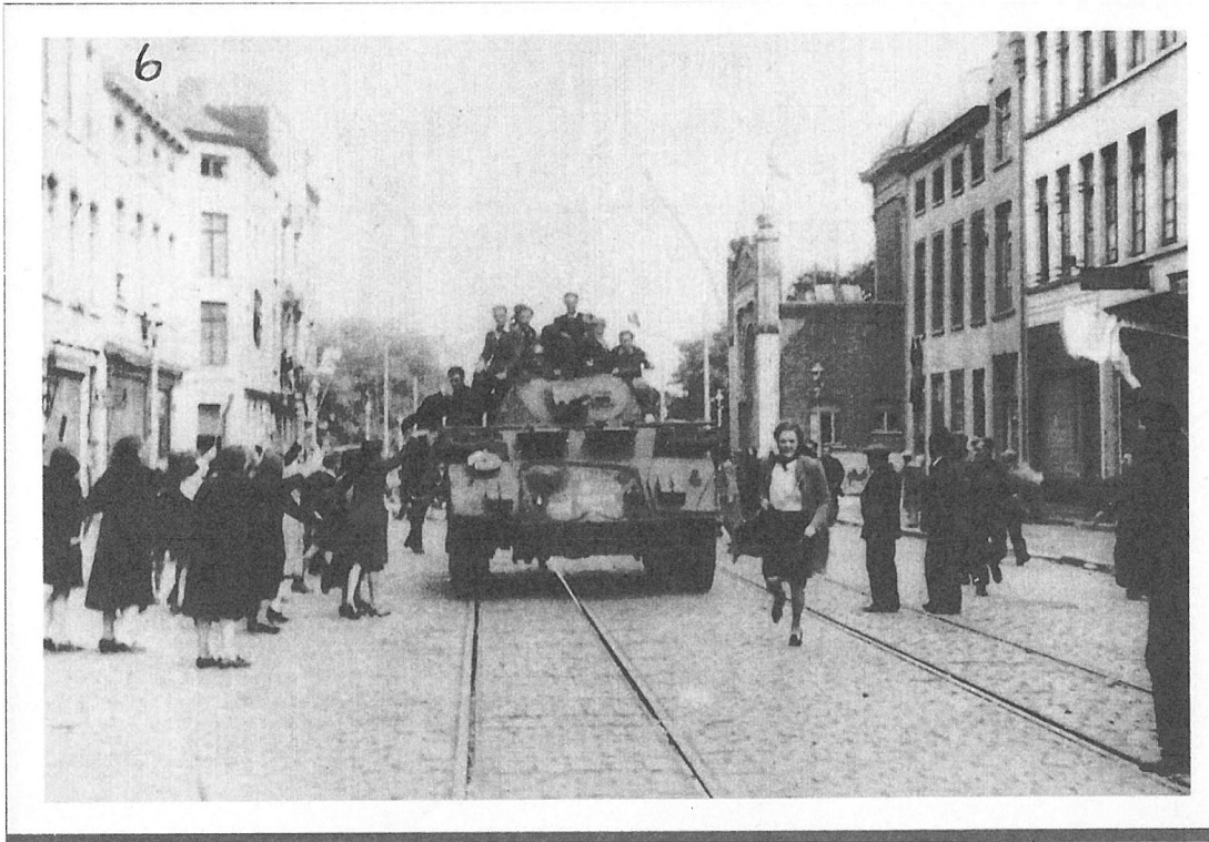
Canadese tanks bij het huidige Canadaplein