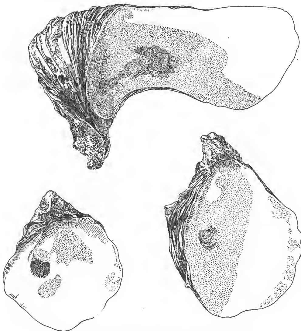
FIG. 1. — Couches crayeuses chez G. angulata Lmk.

sa charnière, a changé sa direction à l'intérieur de sa coquille de telle sorte que cette dernière a été sécrétée dans une direction faisant