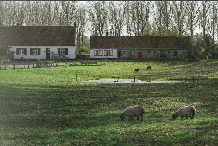
Hoeve Ten Houcke Boven op de middeleeuwse dijk in het vlakke polderlandschap