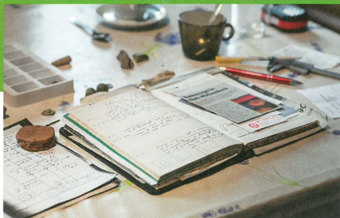
Alles wordt nauwgezet bijgehouden en genoteerd: waar, wanneer en hoe een vondst werd gevonden