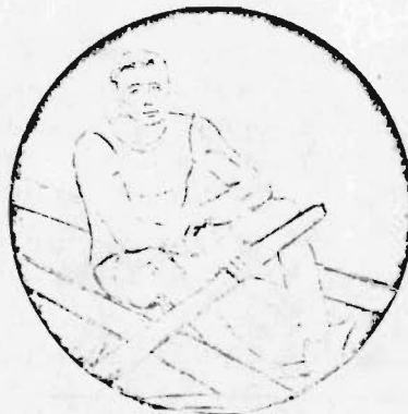
1960 medaille in brons ø 50 mm