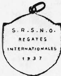
1937 medaille in verzilverd brons ø 28 mm met ring