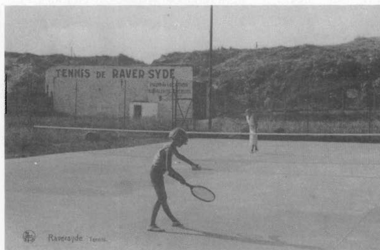
In de Duinenweg te Raversijde (1932)