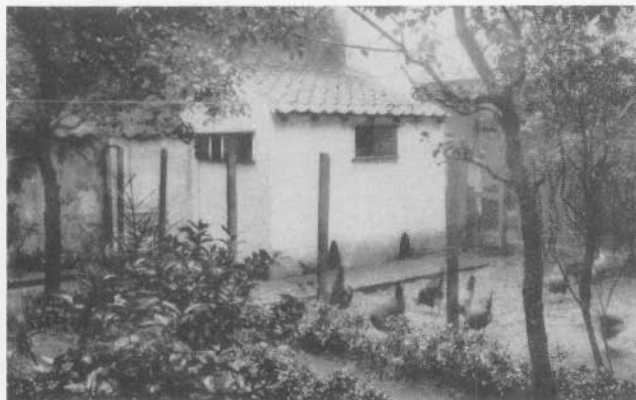
Kippen gekweekt in het Sint-Jozefsinstituut (later Sint-Andreas) in de Kaaistraat (circa 1925).