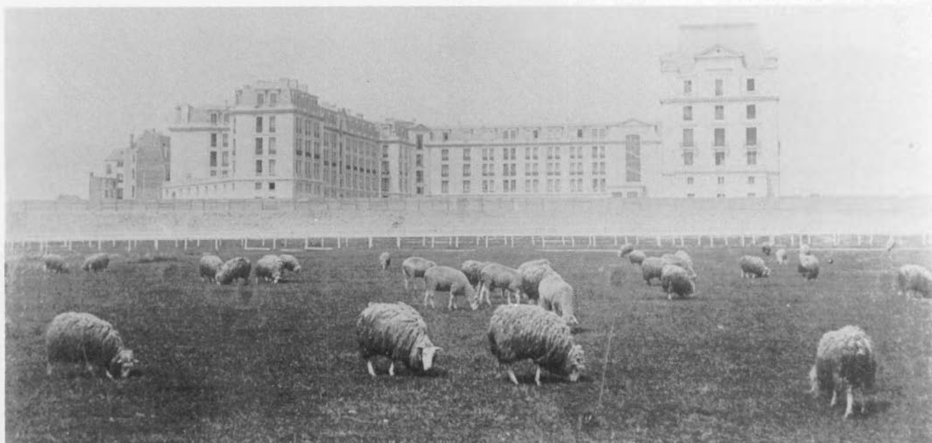
Een schapenkudde in de Wellingtonrenbaan, nabij het palace-hotel (circa 1908).