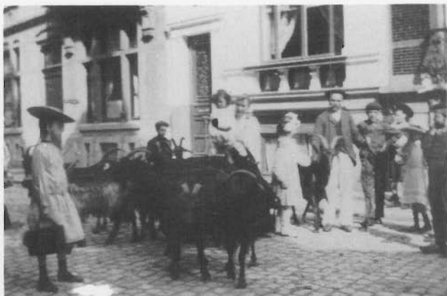
De Italiaanse geitenboer die melk verkocht (hier in de Euphrasina Beernaertstraat circa 1906).