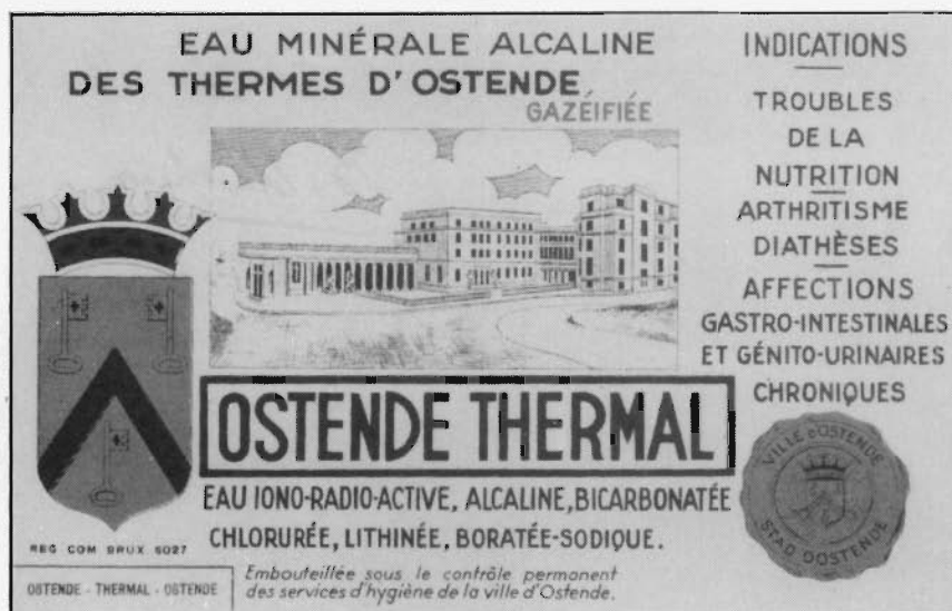
Het mooie flessenetiket met het Thermanaal Instituut er op. Het befaamde "eau d'ostende" behoort nu ook na een halve eeuw tot het verleden. Zal de bron nog eens terug werken?