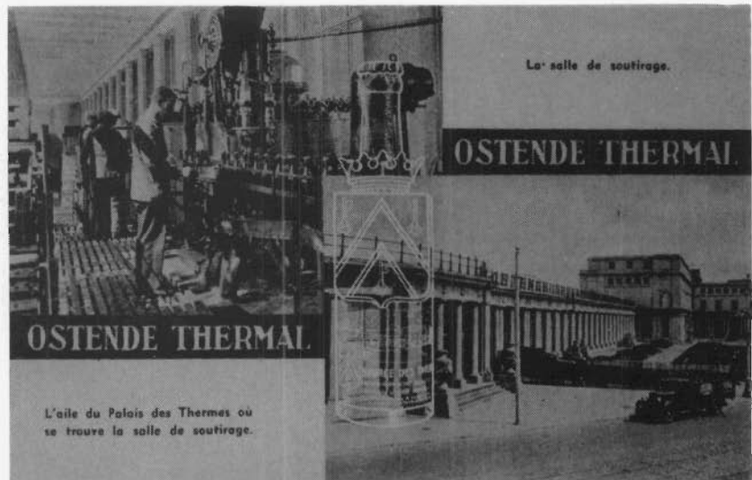
Publiciteitskaart met de bottelmachine voor het Oostends bronwater.