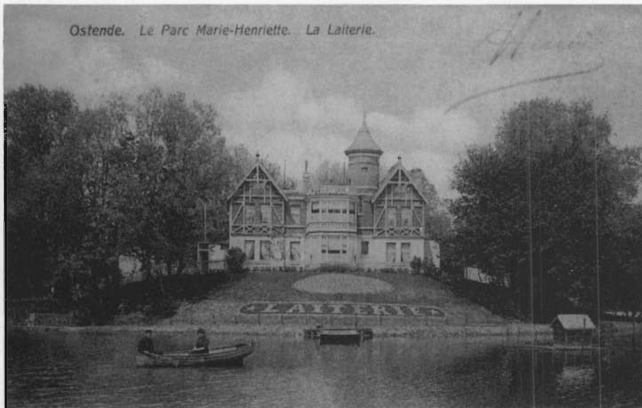
Het oude "LAITERIETJE", thans voor de derde maal herbouwd als "HET KONINGINNEHOF".