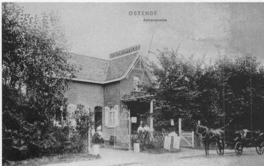
De "ARMENONVILLE", waar de balboogvereniging "SINT-JORIS" gevestigd is, werd ook helemaal verbouwd.