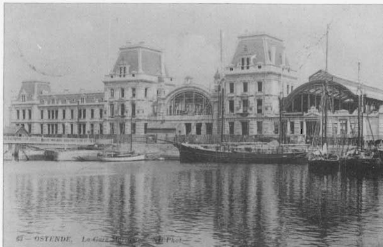
Het Station bijna voltooid in 1912.