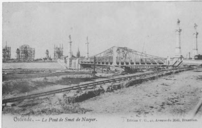
De Smet de Naeyerbrug, toen men nog enkele pilaren en bronzen beelden moest aanbrengen in 1904.