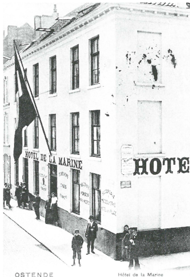
Hôtel de la Marine