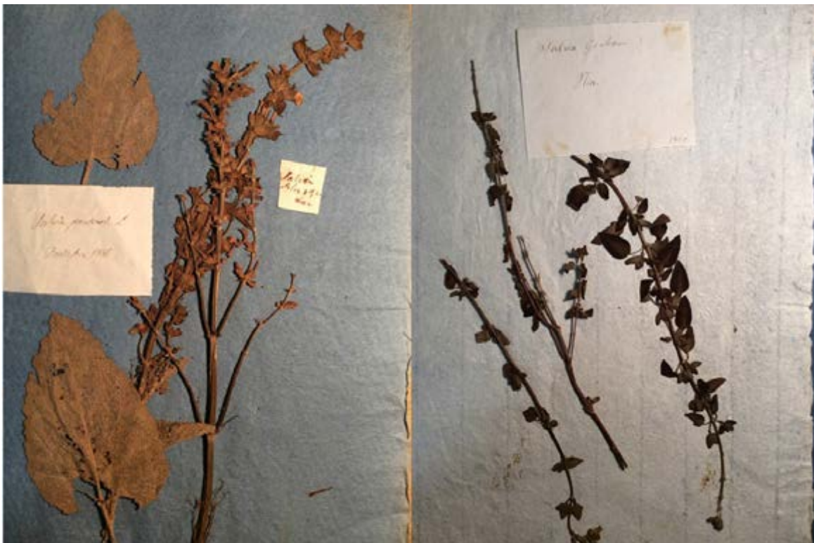
Figura 2. Salvia pratensis (izquierda) y Salvia microphylla var. microphylla (derecha).

Pliero 1-70, etiquetado en pluma como “ Salvia Grahamii . Nice. 1860”. Consiste en tres ejemplares, todos tallos con hojas, dos de ellos con flores en el ápice. Buen estado de conservación.