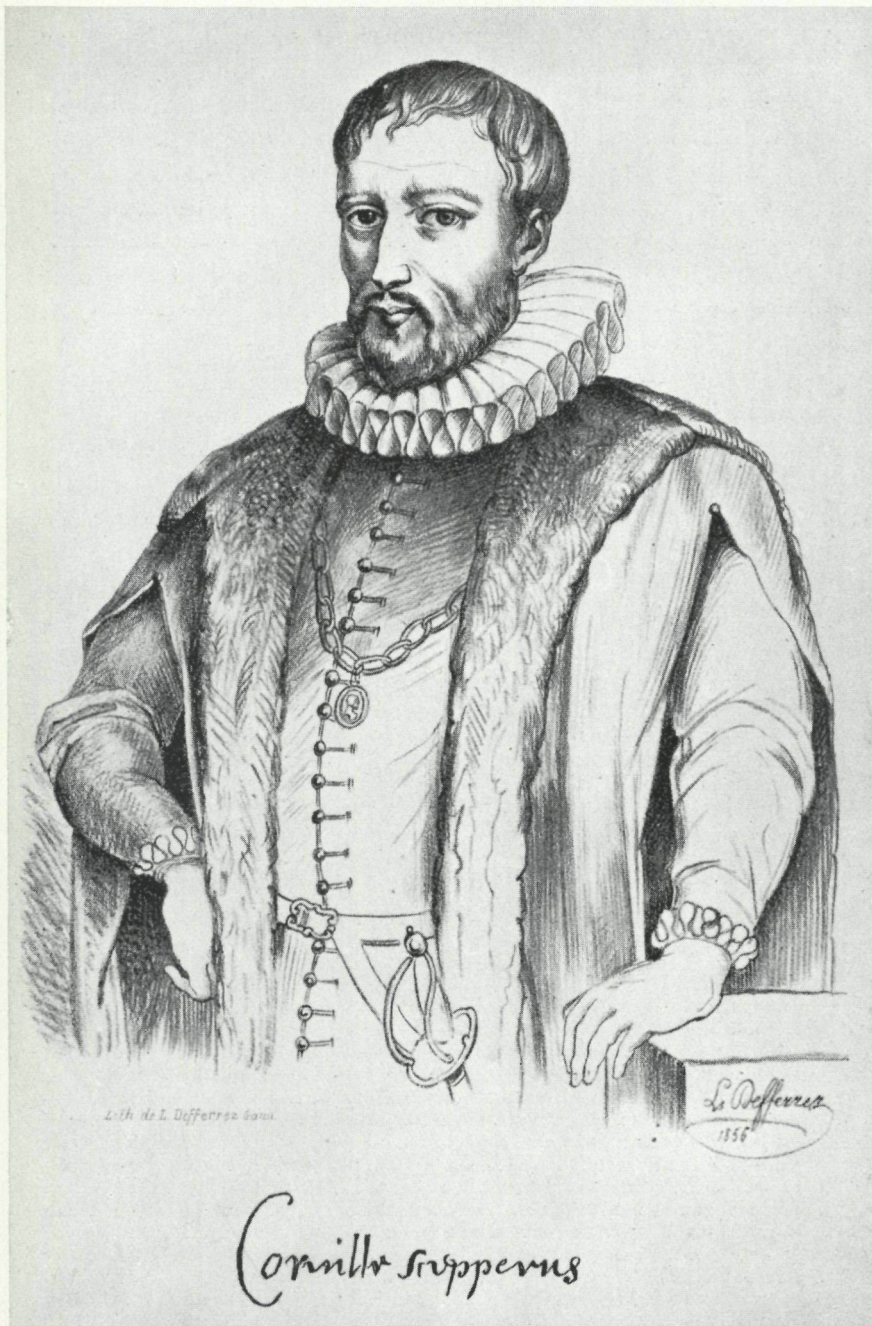
Cornelius de SCHEPPERERE geboren te Nieuwpoort in 1502, overleden te Antwerpen de 28 e Maart 1554.