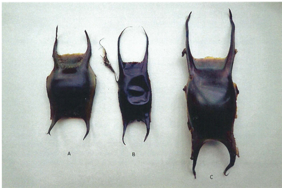
Foto 2 : Kapsels van A: Stekelrog Raja clavata , B: Gevlekte rog Raja montagui , C Golfrog Raja undulata