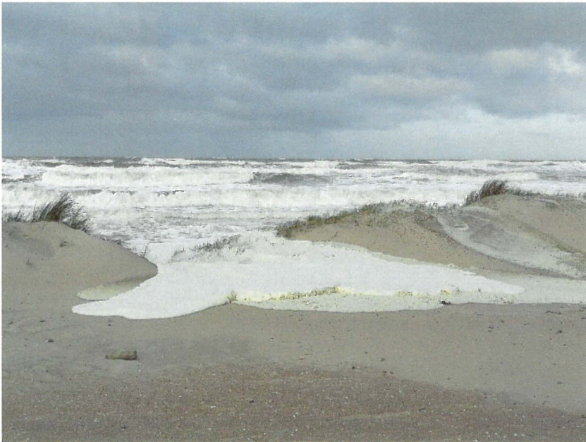
Foto 1: Het Schipgat (Oostduinkerke) bij springtij op 8 januari 2019.

Op 8 en 9 januari heerste de eerste winterstorm van 2019. Die zorgde op bepaalde stranden, vooral te Bredene, weer voor 2 meter hoge kliffen maar langs de Westkust was daar niet zoveel van te merken. Wel verdwenen er tussen Koksijde en Oostduinkerke weer stukken van het duin in zee. Er lagen in die zone ook heel wat pakketten Helmgras met wortel op het strand. Weggerukt door de hoge golven en stevige wind (foto 1).