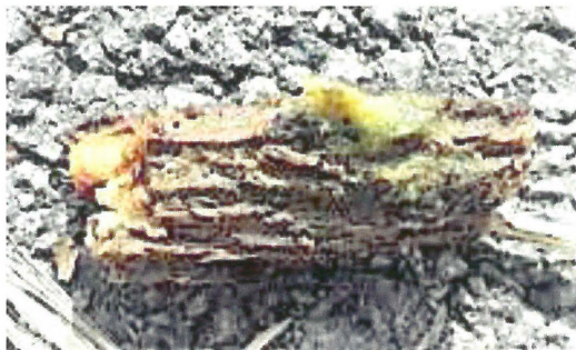
Foto 1 : Echte zoetwaterspons Ephydatia fluviatilis

De spons vormde een geel korstje met een lengte van ongeveer 5 cm op een takje (foto 1). Omdat er twee soorten sponzen (de Zoetwaterspons Spongilla lacustris en de Echte zoetwaterspons Ephydatia fluviatilis ) voorkomen in onze wateren die uiterlijk sterk op elkaar gelijken is het determineren op uitzicht niet mogelijk. De enige manier om zeker te zijn over welke soort het gaat is de skeletnaaldjes onder een microscoop bekijken. We namen met drie personen een stukje mee met de bedoeling dit te doen. Het sponsje dat we vonden is de Echte zoetwaterspons Ephydatia fluviatilis . De spicula van deze soort bestaat vooral uit lange dubbelpuntige naalden (180-550um) maar meer kenmerkend zijn de kleine haltervormige deeltjes (25 um) (foto 2).